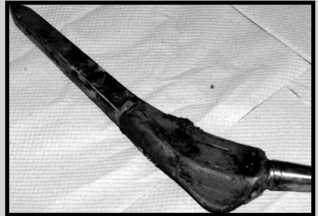
RYS.3. Zmiany korozyjne zachodzące na powierzchni materiału [4]. FIG.3. The corrosion changes occurring on the biomaterial surface [4].

Damaging of the passive surface layer causes a direct contact between cells and the surface of the material. The biomaterial releases the alloy components into the environment surrounding the biomaterial. The corrosion changes occurring on the material surface intensify the inflammation reaction. Its consequence is dieing out of some cells and proliferation of others, which in turn results in remodeling the tissue sticking to the biomaterial [6].