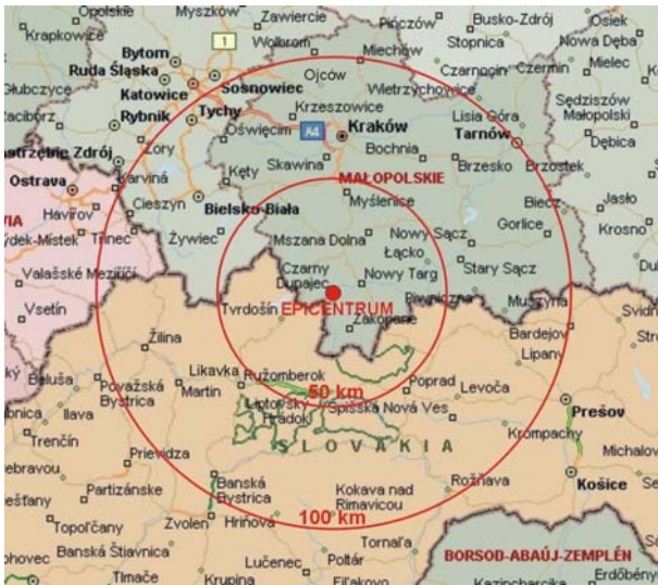
Ryc. 8. Epicentrum trzęsienia ziemi z 30 XI 2004 r. na Podhalu

Richtera. Głębokość ogniska wstrząsu określono na ok. 10 km. Wstrząs odczuwalny był w Małopolsce, na Górnym Śląsku i Słowacji, w promieniu ponad 100 km od epicentrum, które znajdowało się w okolicach Czarnego Dunajca (zob. ryc. 8), ok. 15 km na południowy zachód od Nowego Targu. Według relacji mieszkańców trzeszczały ściany domów, drgały szyby, przesuwały się meble, spadały doniczki z kwiatami i inne przedmioty. Po wstrząsie głównym zaobserwowano liczne słabsze wstrząsy następce. Występowanie trzęsień ziemi na Podhalu nie jest niczym wyjątkowym, gdyż podobne zjawiska obserwowano na tym terenie w przeszłości. Poprzedni wstrząs sejsmiczny o sile ok. 3,7 stopni w skali Richtera miał miejsce dnia 11 IX 1995 r. (dwa mniejsze wstrząsy następce wystąpiły 13 X 1995 r.). Zdaniem sejsmologów występowanie trzęsień ziemi na terenie Podhala to efekt ciągłego wypiętrzania się Karpat.