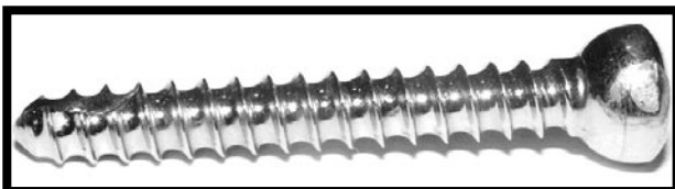
RYS. 1. Śruba zespalająca kość. FIG. 1. The screw joining the bone.

Materiałem badanym była stal austenityczna, co potwierdza przeprowadzona analiza składu chemicznego (RYS. 2).