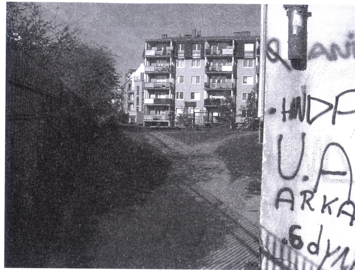
Fot. 3. Gdynia Zachód. Zdezintegrowane, gniazdowe struktury mieszkaniowe osiedli deweloperskich

struktury mieszkaniowej. Takie procesowe podejście mogłoby sprawić, że Gdynia Zachód zaistniałaby w systemie struktur przestrzennych Trójmiasta jako wielofunkcyjny, stopniowo osiągnięty dojrzałość park miast, w którym tereny zagospodarowane przez urbanistyczne i rekreacyjne inwestycje harmonijnie współistnieją z obszarami chronionego krajobrazu.