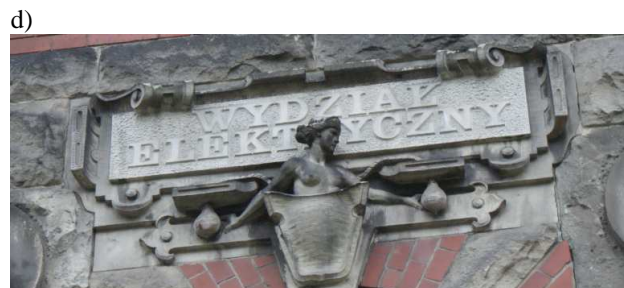
Rys. 2. Widok dzienny iluminowanej elewacji i wyróżnienie charakterystycznych jej elementów: a) widok ogólny, b) tarcza ze znakiem „+”, c) dekoracja narożna – salamandry, d) kartusz z napisem „Wydział Elektryczny”

Interesująca architektura budynku skłania do jej wyeksponowania również po zmierzchu. Aby wyeliminować próby terenowe iluminacji, można