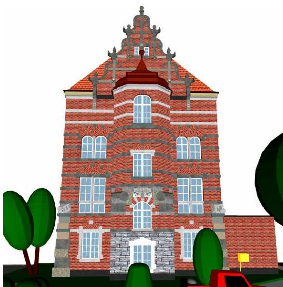
Rys. 3. Dwa odwzorowania (a) i (b) widoku dziennego elewacji różniące się teksturą materiałów

Na rysunku 3 przedstawiono dwa różne odwzorowania widoku dziennego elewacji. Rozwiązania te różnią się przyjętą teksturą elementów elewacji, a w szczególności parametrami cegły. W koncepcji z rysunku 3a zastosowano cegłę czerwoną o numerze 4, natomiast w przypadku rysunku 3b jest to cegła czerwona o numerze 2.