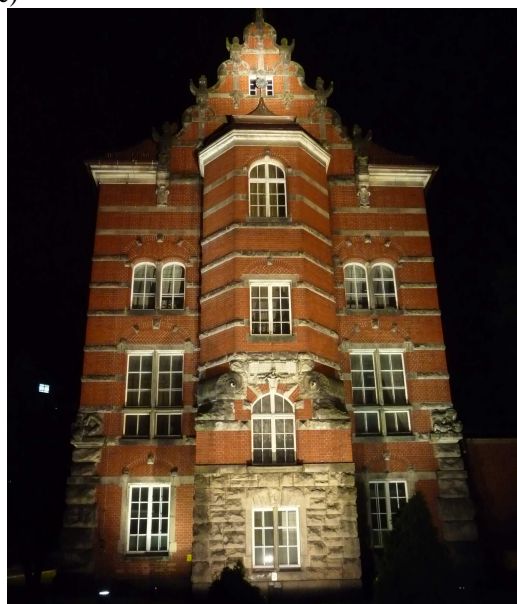
Rys. 5. Iluminacja metodą zalewową: a), b) wizualizacja komputerowa, c) próby terenowe przy obiekcie rzeczywistym

W wizualizacji przedstawionej na rysunku 6 zastosowano naświetlacze montowane na słupach w znacznej odległości od obiektu – oświetlają górną część elewacji, oraz naświetlacze umiejscowione w ziemi oświetlające od dołu niższe partie obiektu. Dzięki zastosowaniu naświetlaczy na słupach lepiej doświetlona jest górna część elewacji. Wykorzystanie światła mieszanego (lampy sodowe i metalohalogenkowe) zmienia nieco barwę elewacji na chłodniejszą.