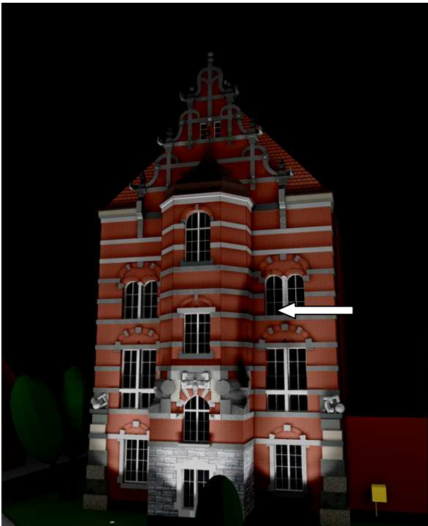
Rys. 9. Wizualizacja iluminacji przy nieprawidłowym usytuowaniu naświetlacza na słupie. Strzałką wskazano cień drzewa

Boczne fragmenty elewacji są oświetlone naświetlaczami umieszczonymi na poziomie ziemi. Tym sposobem oświetlono również część środkową do wysokości pierwszego piętra. Zastosowano również dwa naświetlacze na słupach oraz dodatkowo naświetlacze o wąskim rozsyłe umieszczone na ukośnych powierzchniach środkowej części obiektu wysuniętej do przodu. Naświetlacze te zmieniły kształt elewacji (tekstura elewacji – cegła czerwona nr 3) i sprawiają, że odnosi się wrażenie, iż fragmenty murów mają przewężenia.