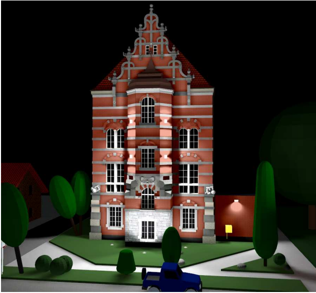
Rys. 8. Wizualizacja iluminacji z wykorzystaniem metody mieszanej