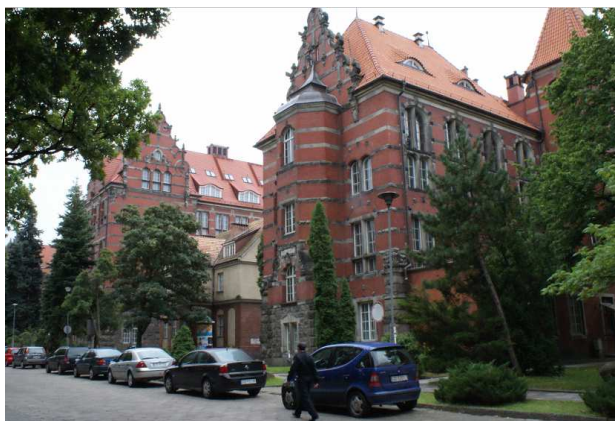
Rys. 1. Widok obiektów Politechniki Gdańskiej. Na pierwszym planie Gmach Wydziału Elektrotechniki i Automatyki

Historia Gmachu Wydziału Elektrotechniki i Automatyki sięga początku dwudziestego wieku [1]. Gmach ten wraz innymi obiektami tworzył pierwszy zespół obiektów Politechniki Gdańskiej (rys. 1). Ściany zewnętrzne są wykonane z cegły rozdzielonej pasami z szarego piaskowca. Elewacje zawierają szereg ozdobnych detali architektonicznych. Projekt iluminacji dotyczy elewacji północno-wschodniej (rys. 1 i 2a) znajdującej się przy drodze dojazdowej i parkingu. W czasie trwania roku akademickiego zauważa się tu duże natężenie ruchu pieszych. Elewacja północno-wschodnia zawiera m.in. tarcze ze znakiem plus i minus („+” i „-”) – symbole elektryczności (rys. 2), dekoracje narożne (rys. 2c), kartusz z napisem „Wydział Elektryczny” (rys. 2d).