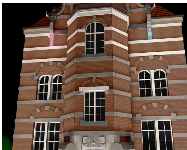
Rys. 7. Barwne wyeksponowanie znaków „+” i „-”

Rysunek 7 przedstawia barwne wyeksponowanie znaków „+” i „-” poprzez zastosowanie lokalnych naświetlaczy z filtrami barwnymi. Zastosowanie naświetlaczy o wyższej temperaturze barwowej niż w przypadku wizualizacji przedstawionej na rysunkach 5a i 5b pozwoliło uzyskać barwę elewacji zbliżoną do tej postrzeganej przy świetle dziennym (rys. 2).