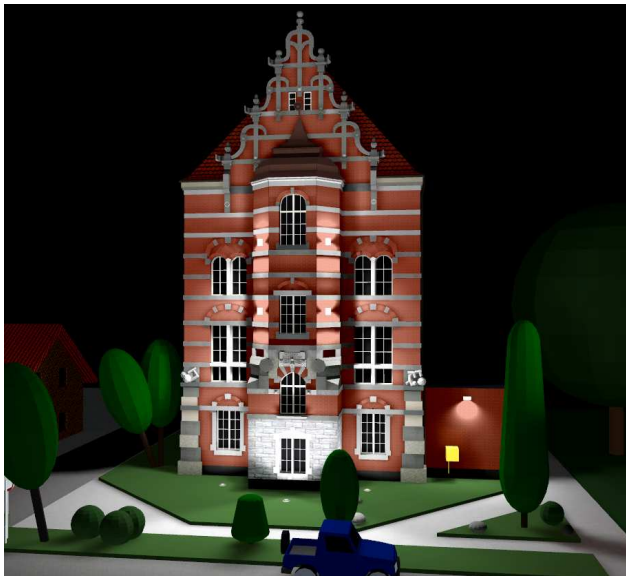
Rys. 8. Wizualizacja iluminacji z wykorzystaniem metody mieszanej

Boczne fragmenty elewacji są oświetlone naświetlaczami umieszczonymi na poziomie ziemi. Tym sposobem oświetlono również część środkową do wysokości pierwszego piętra. Zastosowano również dwa naświetlacze na słupach oraz dodatkowo naświetlacze o wąskim rozsyłe umieszczone na ukośnych powierzchniach środkowej części obiektu wysuniętej do przodu. Naświetlacze te zmieniły kształt elewacji (tekstura elewacji – cegła czerwona nr 3) i sprawiają, że odnosi się wrażenie, iż fragmenty murów mają przewężenia.