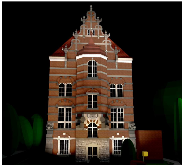
Rys. 6. Wizualizacja iluminacji z wykorzystaniem naświetlaczy umieszczonych na poziomie ziemi oraz na dwóch słupach

W wizualizacji przedstawionej na rysunku 6 zastosowano naświetlacze montowane na słupach w znacznej odległości od obiektu – oświetlają górną część elewacji, oraz naświetlacze umiejscowione w ziemi oświetlające od dołu niższe partie obiektu. Dzięki zastosowaniu naświetlaczy na słupach lepiej doświetlona jest górna część elewacji. Wykorzystanie światła mieszanego (lampy sodowe i metalohalogenkowe) zmienia nieco barwę elewacji na chłodniejszą.