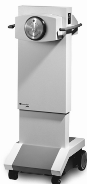
Rys. 2 Aparat do brachyterapii HDR

Do brachyterapii służy aparat nazywany jest HDR'em lub Afterloader'em (Rys. 2). Źródłem promieniowania radioaktywnego jest Iryd 192, którego połowiczny czas rozpadu wynosi 74 dni. Źródło promieniowania, przymocowane do stalowej linki, jest przemieszczane w aplikaturze za pomocą silnika krokowego. Fizycy medyczni planują kolejne pozycje i czasy postoju źródła w obszarze guza i jego okolicy, biorąc pod uwagę anatomię pacjenta, leczony obszar oraz znajdujące się w pobliżu organy wrażliwe na promieniowanie (tzw. organy ryzyka, które wykazują obniżoną odporność na promieniowanie jonizujące, a ich zniszczenie nie jest obojętne dla funkcji życiowych pacjenta, np. rdzeń kręgowy).