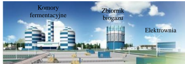
Rys. 2. Widok instalacji do wytwarzania biogazu w GOŚ [6] Fig. 2. View of biogas generation system in GOS [6]

Przykładem nowoczesnej oczyszczalni ścieków z rozbudowaną instalacją wytwarzania i utylizacji biogazu jest Grupowa Oczyszczalnia Ścieków w Łodzi (rys. 2). Instalacja produkcji biogazu składa się m.in. z trzech komór fermentacyjnych o pojemności 10 000 m 3 każda. Wyprodukowany w procesie fermentacji biogaz poddawany jest odsiarczaniu i magazynowaniu. Następnie przez stacje dmuchaw podawany jest do największej polskiej elektrociepłowni biogazowej składającej się z trzech agregatów prądotwórczych o łącznej mocy elektrycznej ok. 2,7 MW oraz cieplnej – ok. 3,5 MW, które zaspakają potrzeby oczyszczalni w około 90%. W systemie ciągłym pracują dwa agregaty, trzeci stanowi zabezpieczenie na wypadek awarii.