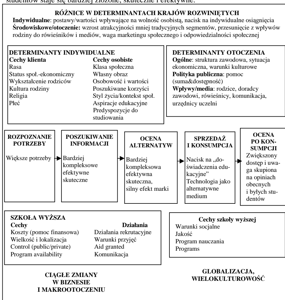
Rys. 2. Współczesny model wyboru studentów dla krajów rozwiniętych ( higher education student-choice model for developed countries )

potrzeby niż ci z krajów mniej rozwiniętych. Na zdefiniowanie potrzeb klientów w tych krajach większy wpływ ma komunikacja marketingowa, która adekwatnie do rosnących potrzeb również się zmienia. Innym założeniem do niniejszego modelu jest fakt, że zachowanie klientów w krajach rozwiniętych zmienia się szybciej ze względu na szersze otoczenie marketingowe. Zmieniają się segmenty i ich cechy (np. zyskowność). Ze względu na dostępność technologii (np. Internet), intensywność komunikacji marketingowej i wzrost liczby dostępnych możliwości poszukiwanie informacji przez studentów staje się bardziej złożone, skuteczne i efektywne.