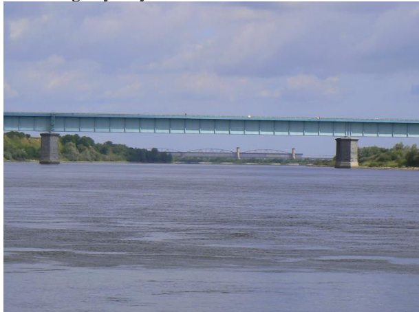
f) mosty kolejowy i drogowy w Tczewie