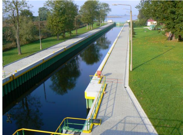
Rys. 7. Połączenie Wisły z Martwą Wisłą przez śluzę Przegalina (zdjęcie satelitarne google), (fot. W.Sterpejkowicz-Wersocki)

Rzeka Martwa Wisła o długości 11,5 km spełnia wymagania określone dla klasy Vb drogi wodnej z ograniczeniem szerokości śluzy B – do 11,91 m. Wymieniona śluza jest jedynym obiektem hydrotechnicznym na tej trasie. Została ona wybudowana pod koniec lat siedemdziesiątych XX w., zastępując usytuowaną równolegle starą śluzę z końca XIX w. Parametry techniczne śluzy przedstawiono w tablicy 4.