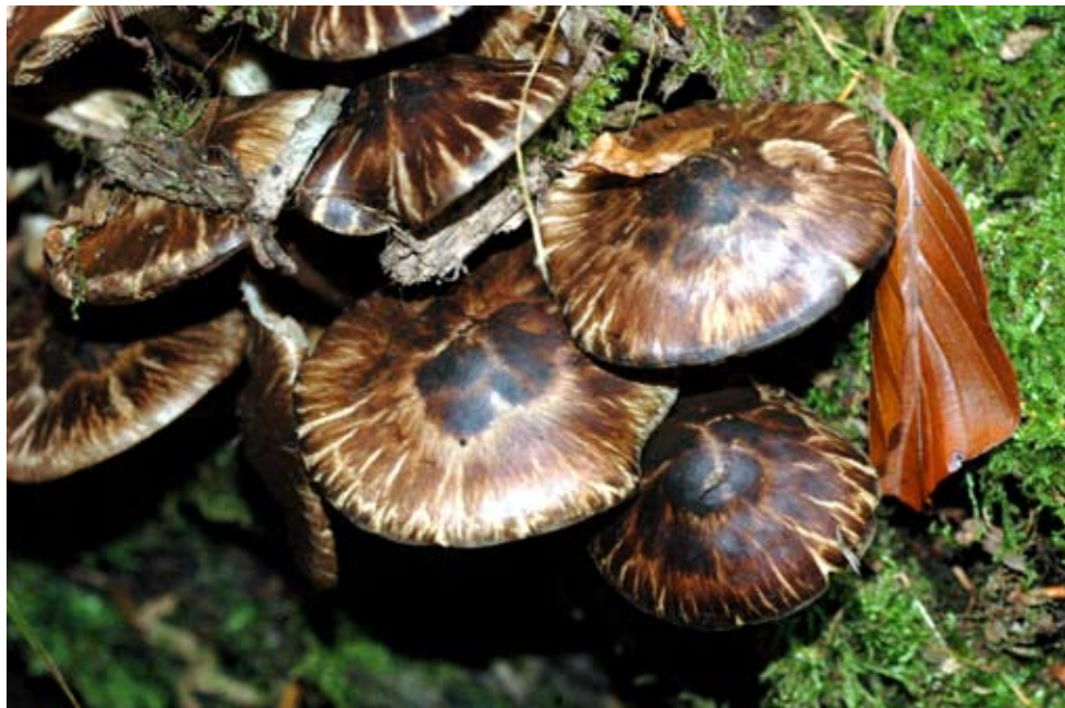
Fot.1. Owocniki kruchaweczki plamistej Psathyrella maculata, rezerwat przyrody „Zamkowa Góra”, 11.10 2008