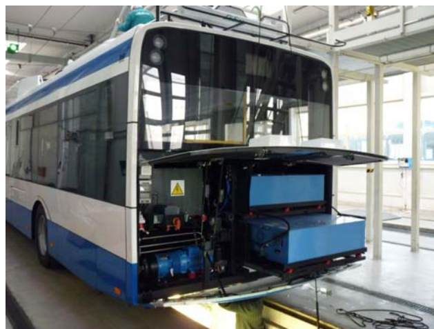
Fot. 2. Baterie trakcyjne (dwie niebieskie skrzynie z prawej strony) oraz przekształtnik baterii (lewa strona) trolejbusu Solaris Trollino 12 / Medcom.

Należy nadmienić, że baterie trakcyjne zostały zastosowane także w trolejbusach Mercedes O405N budowanych we własnym zakresie przez PKT Gdynia na bazie wycofanych z eksploatacji autobusów. W odróżnieniu od pojazdów Trollino, zastosowano w nich baterie o mniejszej pojemności, składające się z 60 ogniw STH 800. W celu uproszczenia aparatury elektrycznej zrezygnowano w nich także z montażu przetwornicy podwyższającej napięcie baterii – układ