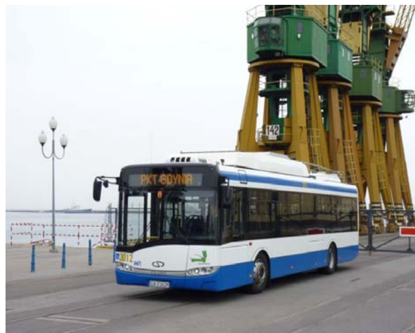
Fot. 1. Trolejbus Solaris Trollino 12 / Medcom wyposażony w baterie nikielowo-kadmowe firmy SAFT.

Bazując na przedstawionych powyżej argumentach podjęto decyzję o zakupie trolejbusów wyposażonych w pomocniczy napęd akumulatorowy. Z dostępnych na rynku technologii wybrano baterie nikielowo-kadmowe. Podstawowym czynnikiem stojącym u podstaw tej decyzji była żywotność ogniwy wykonanych w tej technologii potwierdzona doświadczeniami eksploatacyjnymi innych użytkowników. Zaletą baterii nikielowo-kadmowych jest także ich duża przeciążalność prądowa, mająca kluczowe znaczenie w przypadku napędów trakcyjnych.