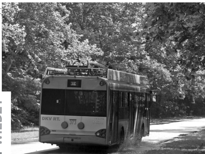
8. Solaris Trollino 12D eksploatowany w ruchu liniowym w węgierskim Debreczynie, Mikołaj Bartłomiejczyk