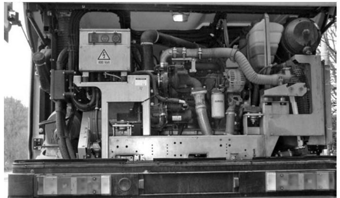
Fot. 2. Agregat spalinowy diesla zamontowany w trolejbusie Škoda 24Tr w przedsiębiorstwie trolejbusowym Zlín-Otrokovice, fot. Mikołaj Bartłomiejczyk