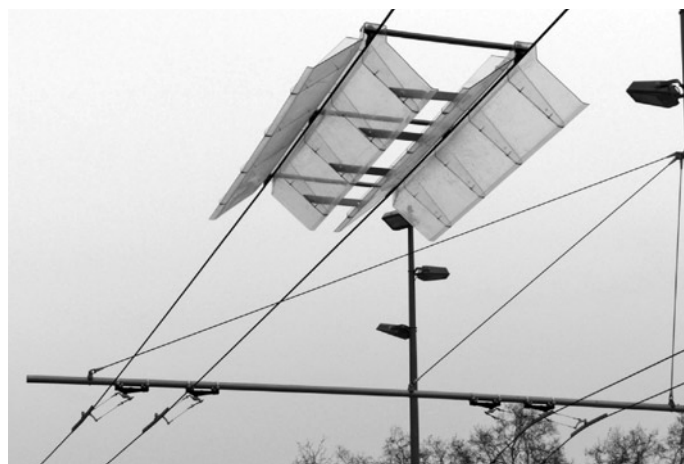
Fot. 6. Specjalne „daszki” do automatycznego kotwienia odbieraków prądu do przewodów sieci trakcyjnej, Castellon

Spośród 155 sieci trolejbusowych zlokalizowanych w Europie (z wyłączeniem Federacji Rosyjskiej), 53 posiadają doświadczenia w zakresie wykorzystania alternatywnych źródeł zasilania, w ruchu awaryjnym lub regularnym (fot. 6,7,8,9,10). Najwięcej systemów komunikacji trolejbusowej, eksploatujących trolejbusy wyposażone w dodatkowe źródło zasilania funkcjonuje w Szwajcarii – 13 miast, we Włoszech – 9 miast oraz w Czechach – 6 miast (tab. 1 i 2). Dominującym rozwiązaniem stosowanym obecnie w komunikacji trolejbusowej jest agregat spalinowy, wykorzystywany przez 46 miast. Mniejsze doświadczenia, przede wszystkim ze względu na ograniczoną dostępność rozwiązania w przeszłości, dotyczą baterii trakcyjnych (7 miast) i superkondensatorowych zasobników energii (5 miast).