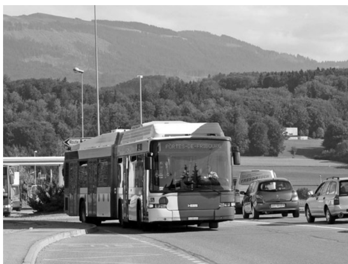
Fot. 10. Trolejbus HESS eksploatowany w ruchu liniowym w szwajcarskim Fribourgu