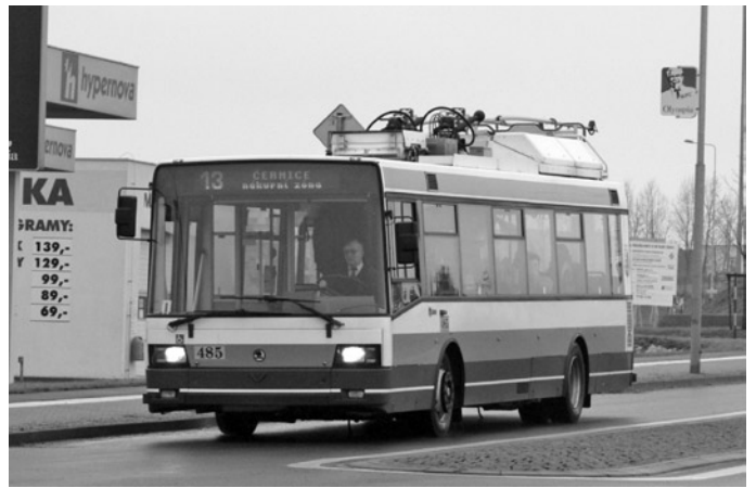
Fot. 1. Škoda 21TrACI w Pilźnie w trakcie przejazdu przy zasilaniu z agregatu spalinowego

Baterie trakcyjne dostępne są w różnych technologiach i zazwyczaj dedykowane każdemu przedsiębiorstwu indywidualnie. W regularnej eksploatacji pozostają w Europie akumulatory ołowiowe, niklowo-wodorkowe, niklowo-kadmowe (fot. 5), a w ostatnich miesiącach rozważa się wprowadzenie do eksploatacji bardzo lekkich litowo-jonowych. Określając zalety baterii, należy jednoznacznie wyznaczyć ich nieemisyjność w odróżnieniu od agregatów spalinowych. Trolejbus korzystający z zasilania bateryjnego pozostaje nadal pojazdem w stu procentach elektrycznym, co jest szczególnie ważne dla przedsiębiorstw eksploatujących łącznie pojazdy korzystające z energii elektrycznej. Kostanie z agregatów spalinowych jest uciążliwe w zajezdniach niedostosowanych do obsługi pojazdów spalinowych. W przypadku akumulatorów ten aspekt nie występuje, ale i bardziej odczuwalną ich wadą jest ograniczony zasięg.