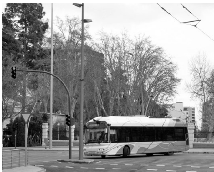
Fot. 7. Trolejbus Irisbus Cristalis zawracający przy zasilaniu z agregatu spalinowego, Castellon, fot. Mikołaj Bartłomiejczyk