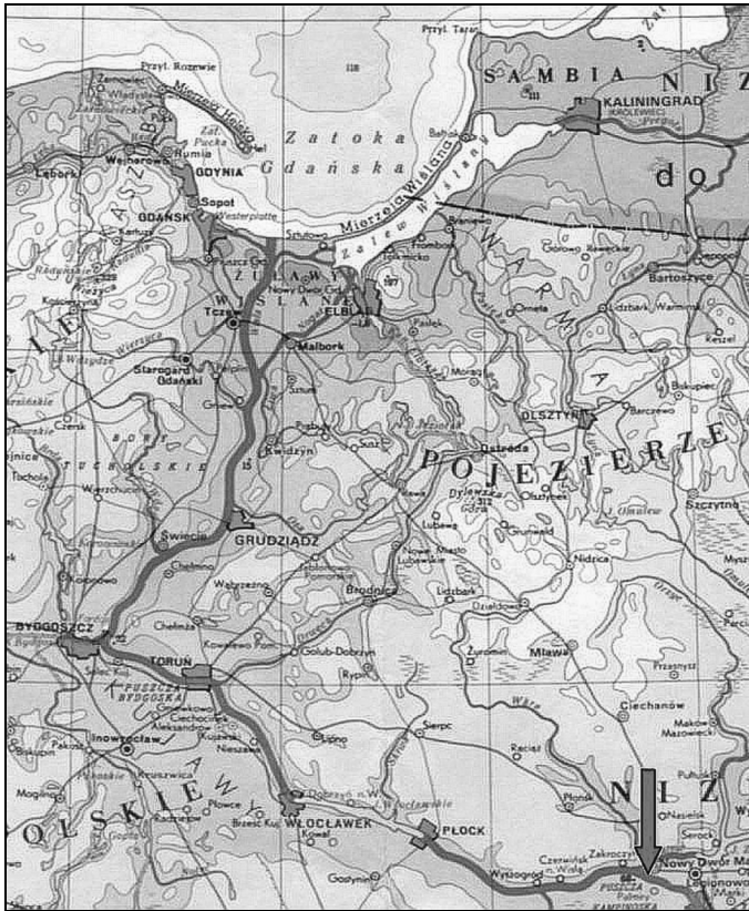
Rys. 2. Dorzecze dolnej Wisły od ujścia Narwi do morza [6]

nętrznymi wynosi 32,7 km zaklasyfikowany jest do III klasy z ograniczeniem zanurzenia T do 1,6 m. Taki stan techniczny spowodowany jest brakiem remontów i inwestycji w ostatnich kilkudziesięciu latach. Obecnie remontuje się około 30 ostróg rocznie, przy istniejących 2800, a jedynym sposobem zapewnienia dogodnych warunków nawigacyjnych jest pełna regulacja Dolnej Wisły, co wiąże się z kompleksową zabudową jej brzegów.