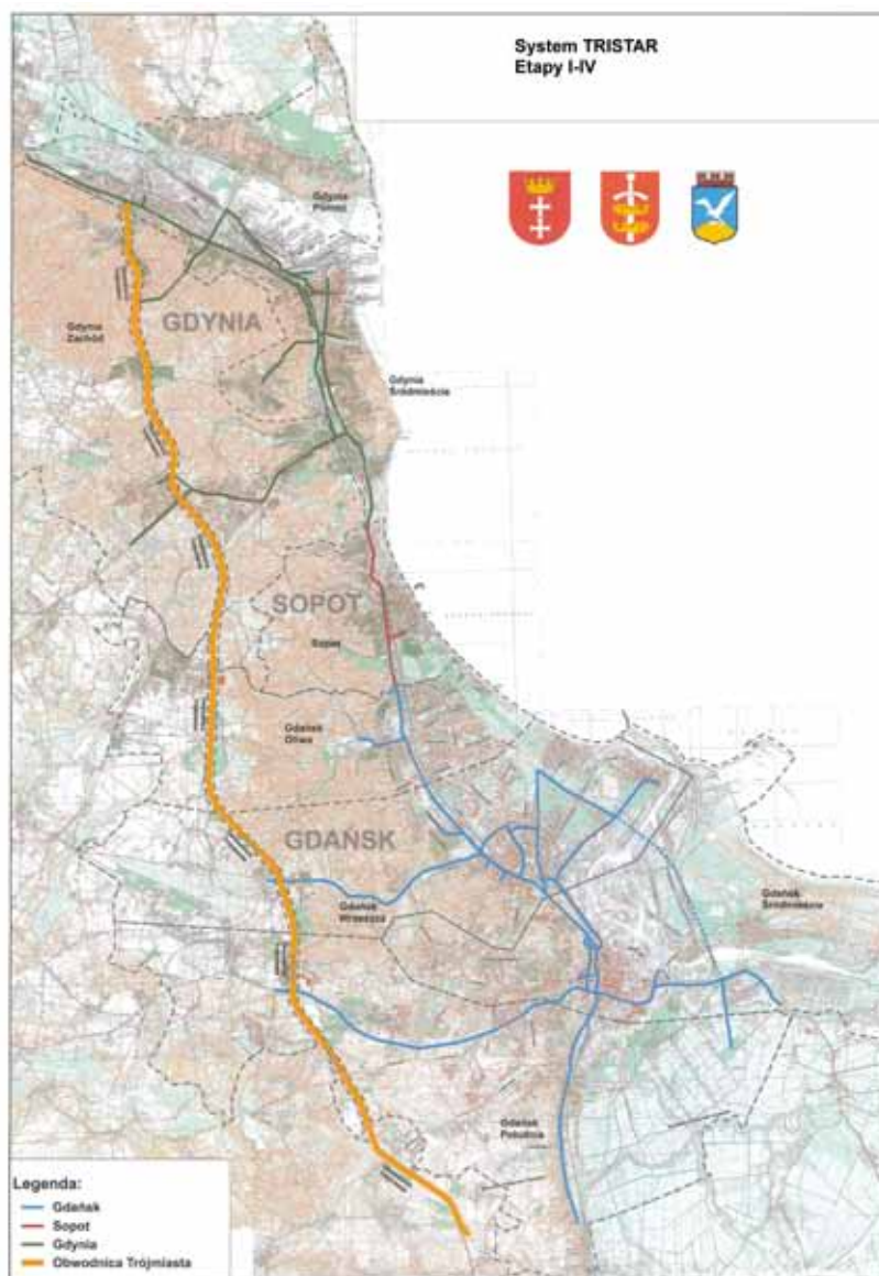
1. Zakres wdrożenia pierwszych etapów systemu TRISTAR

W ramach pierwszych czterech etapów wdrożenia systemu, których realizację przewidziano do 2014 roku, przewidziano budowę Centrów Zarządzania Transportem w Gdańsku (etap I) i Gdyni (etap II) oraz stanowiska operatorskiego w Sopocie z niezbędnym oprogramowaniem, jak również realizację Systemu Planowania Ruchu. Pierwszy i drugi etap obejmie ponadto wdrożenie Systemu Zarządzania Ruchem Miejskim wraz z Systemem Nadzoru Wizyjnego na krytycznych pod względem warunków ruchu ciągach Trójmiasta (w Gdańsku – w ciągu ul. Grunwaldzkiej, na której usprawnienia są niezbędne ze względu na planowane wydarzenia w ramach EURO 2012, w Gdyni – w ciągu ulic 10 lutego, Śląskiej, Zwycięstwa). W trzecim i czwartym etapie zaplanowano wdrożenie podsystemów i modułów opisanych w niniejszym artykule na głównych ciągach Trójmiasta (rys. 1). W pierwszych czterech etapach system zostanie wdrożony na ok. 150 skrzyżowaniach i przejściach dla pieszych, wyposażonych w sygnalizację świetlną. Zaplanowano ponadto budowę infrastruktury połączeń systemowych