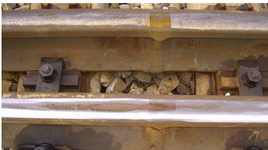
Fot.4. Połączenie iglicy z szyną łączącą spawem termitowym

Na fotografii 5 przedstawiono podobne uszkodzenie, w innym miejscu w tym samym rozjeździe.