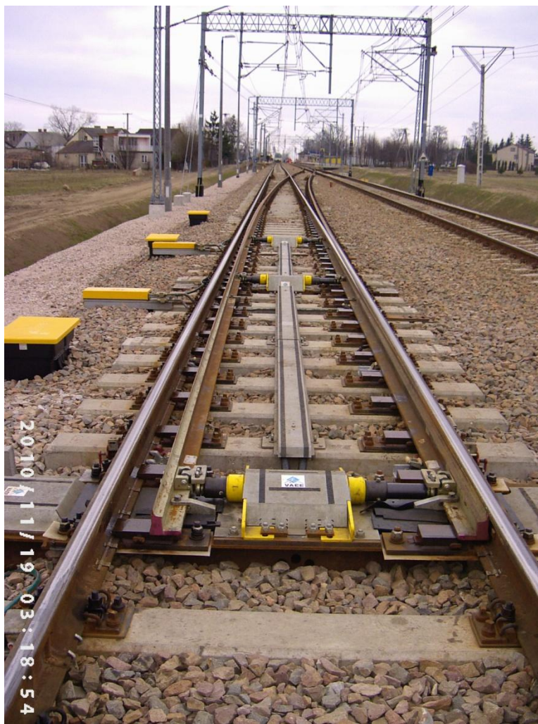
Fot.2. Widok ogólny rozjazdu Nr 1 na stacji G (Rz 60E1 1200 1:18,5)

Na fotografiach Nr 1 i 2 przedstawiono dwa przykładowe ujęcia na etapie oddania rozjazdu kolejowego do eksploatacji. Zdjęcie Nr 2 obrazuje ogólny widok rozjazdu Nr 1 na stacji G, który z dalej widocznym rozjazdem Nr 2 tworzy połączenie dwóch torów równoległych. Natomiast na fotografii Nr 1 pokazano przyleganie iglicy łukowej do opornicy prostej w rozjeździe Nr 1.