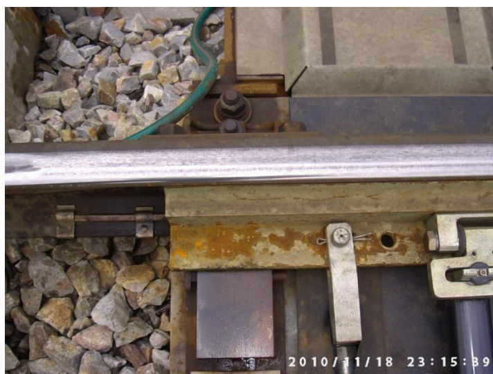
Fot.1. Widok opornicy prostej i iglicy łukowej (przyleganie iglicy do opornicy)

W praktyce diagnostyka obrazowa powinna być stosowana od momentu ułożenia nowego rozjazdu, nawet wtedy, gdy nie wykryto żadnych wad. Należy wówczas wykonać kilka zdjęć ogólnych, np. iglicy i opornicy, krzyżownicy, dzioba krzyżownicy, urządzenia przeciwpełznego oraz widok rozjazdu w stosunku do przyległych torów i innych rozjazdów.