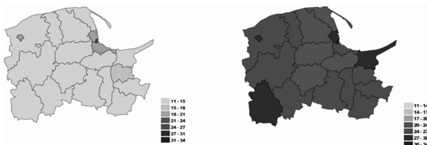
Rysunek 3. Udział osób w wieku 60+/65+ w poszczególnych powiatach województwa pomorskiego odpowiednio w roku 2011 oraz 2035 (w %)

Według prognoz GUS w roku 2035 najwyższy odsetek osób w wieku poprodukcyjnym (60+/65+) zanotują: Sopot – 33%, Słupsk – 29,7%, Gdynia – 27,7%, a także powiaty nowodworski – 27,3% i człuchowski – 27,4%. Oznacza to, że w wymiarze demograficznym, w najtrudniejszej sytuacji będą ośrodki miejskie oraz powiaty, które obecnie charakteryzuje niekorzystna sytuacja ekonomiczna, w tym sytuacja na lokalnym rynku pracy. Należy zatem przyjąć, że o ile w pierwszym przypadku (dużych miast) powodem znaczącego pogorszenia struktury demograficznej lokalnej społeczności jest rosnąca atrakcyjność podmiejskiego stylu życia i odpływ osób młodych z miast do gmin sąsiednich, o tyle w drugim przypadku (powiatów o najwyższej obecnie stopie bezrobocia w regionie) – główny powód stanowi odpływ młodzieży związany z migracją zarobkową.