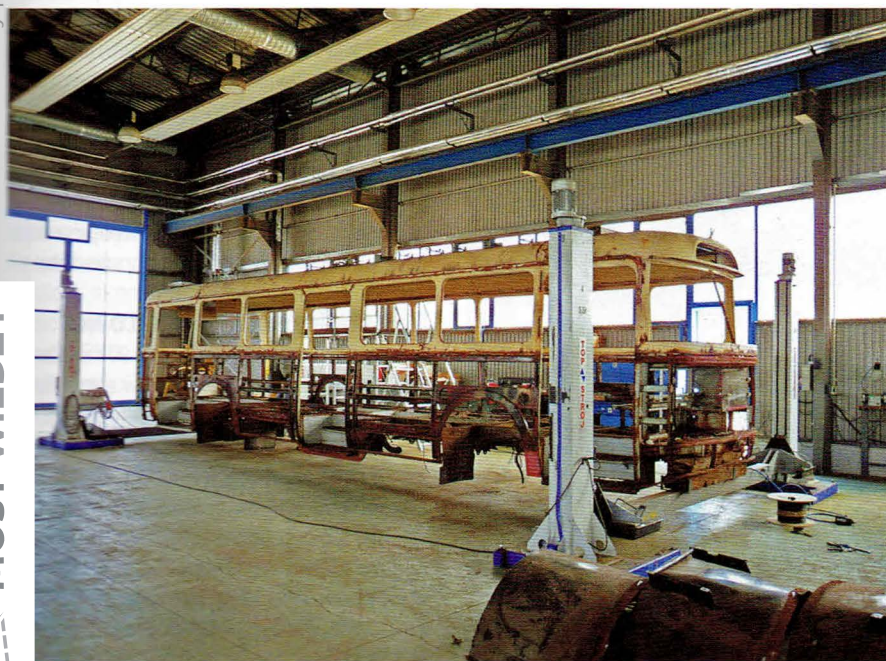
Prace nad konstrukcją po zakończeniu demontażu Škody

W specyfikacji przetargowej zamieszczono także klauzulę zakładającą możliwość poszerzenia zakresu remontu trolejbusu do maksymalnej wartości 120% wynagrodzenia zaoferowanego przy składaniu oferty, w związku z możliwością wystąpienia udokumentowanych czynników, potwierdzonych przez zamawiającego, niemożliwych do przewidzenia na etapie przygotowywania remontu. Klauzula miała umożliwić weryfikację zakresu prac po demontażu całego trolejbusu, a w szczególności