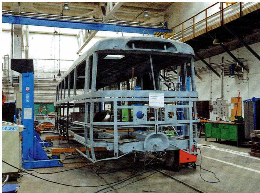
Prace nad konstrukcją trolejbusu po wypiaskowaniu. Wymiana elementów pionowych i poziomych konstrukcji nadwozia