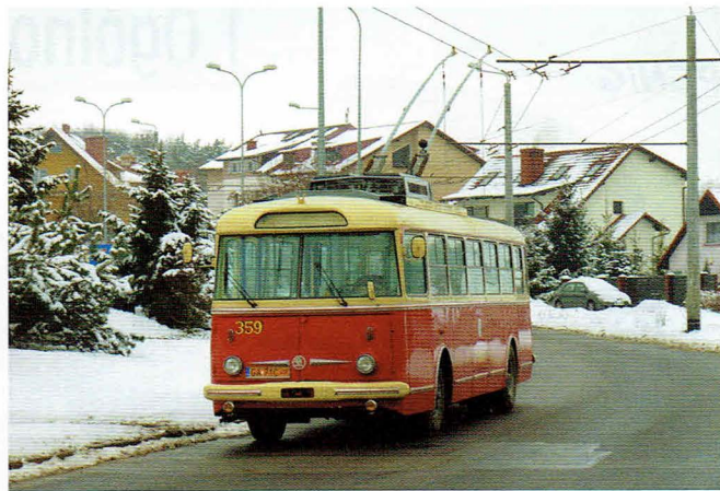
Škoda 9Tr podczasjazd testowych na gdynskich ulicach