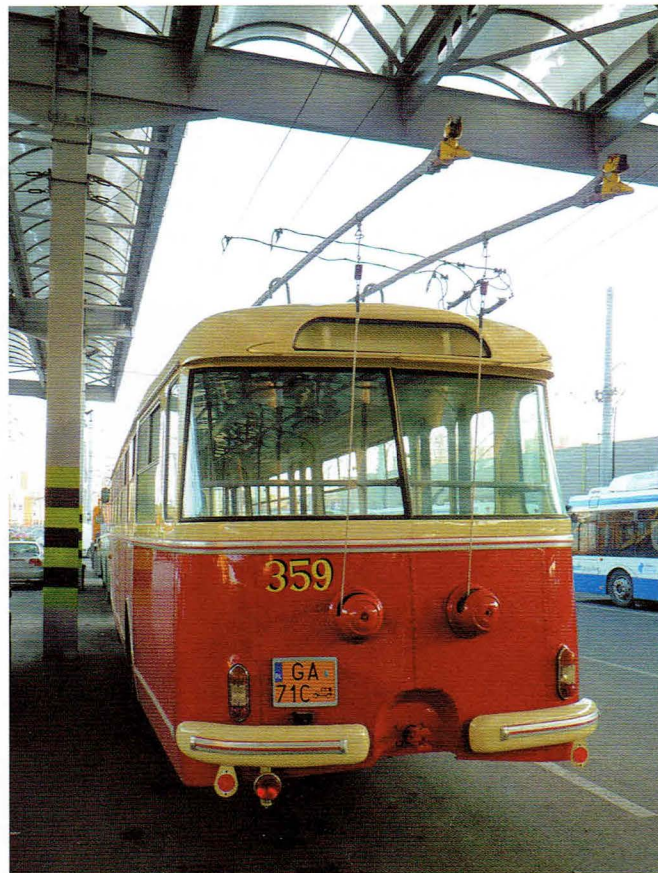
Tyłna ściana trolejbusu wraz z „zabytkową” tablicą rejestracyjną