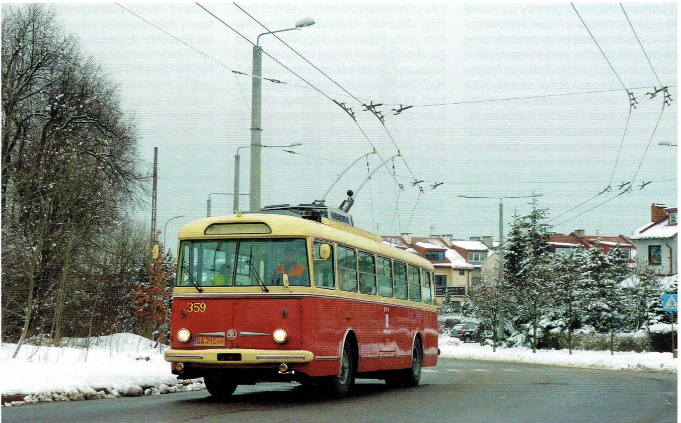
Škoda 9Tr z oznaczeniami typowymi dla 1970 r.