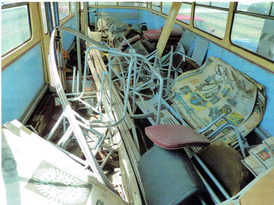
Wnętrze trolejbusu przed remontem. Widoczne, zdemontowane elementy wyposażenia wnętrza i aparatury napędowej

Egzemplarz pozyskany od LTEK to podtyp 9Tr20, lecz w Gdyni najwyższy rodzaj eksploatowanych trolejbusów Škoda to 9Tr15. Różnica pomiędzy najmłodszymi egzemplarzami z Gdyni, a zakupionym wynosiła 5 lat, więc nie wszystkie elementy były oryginalne w historycznym trolejbusie względem „dziewiątek” eksploatowanych w Gdyni, co często niesprawiedliwie powodowało krytykę postronnych osób. Najważniejszym był jednak fakt, że odkupiony od lubelskiego towarzystwa trolejbus posiadał sterowanie stycznikowe. Unikatowość tego trolejbusu podkreśla fakt, że z wyprodukowanych kilkunastu tysięcy trolejbusów typu 9Tr zachowano zaledwie kilka (nie licząc nadal eksploatowanych, zdegradowanych trolejbusów na Ukrainie i w Bułgarii). Muzealne egzemplarze zachowane są w Eberswalde (Niemcy), Kownie i Wilnie (Litwa), Bratysławie