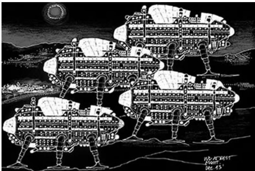
Rysunek 4. Archigram- Walking City