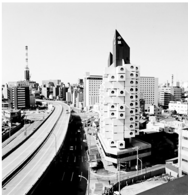
Rysunek 3. Kisho Kurokawa – Nakagin Capsule Tower