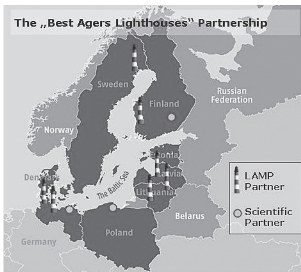
Rysunek 3. Pochodzenie partnerów projektu