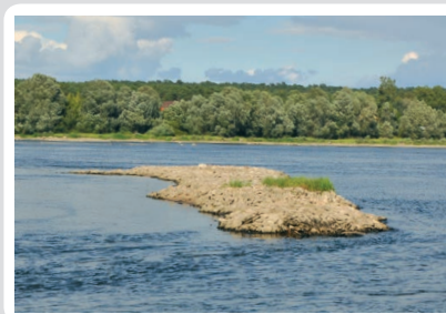
Fot. 1. Ostrogi na dolnej Wiśle

Budowle hydrotechniczne służące żegludze śródlądowej spełniają wiele innych funkcji. Regulują bieg rzeki (fot. 1), wpływają na rozwój turystyki, przyczyniają się do polepszenia stanu jakości wód (m.in. turbiny elektrowni wodnych poprawiają napowietrzanie wody). Obiekty wodne zapobiegają także procesowi pustynienia obszarów oraz spełniają funkcję przeciwpowodziową.