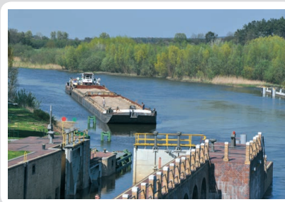
Fot. 5. Zestaw pchany wpływający do służy w Białej Górze

Tabor żeglugi śródlądowej, w większości wybudowany w latach 70. ubiegłego wieku, jest przestarzały, tzn. zużyty technicznie i moralnie.