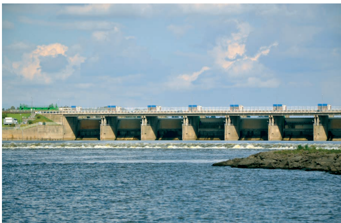
Photo 6. The Włocławek barrage, view from the lower water

The third section of the lower Vistula (dolna Wisła) waterway, from the Nogat to the mouth of the Vistula (Wisła), is also fully engineered. The width of the river engineering route applied there (250 m) ensures that the depths on sandbars do not drop to below 1.60 m. Only near Piekło, over a 5 km section, the depths decrease on sandbars to about 1.30 m. From the navigation perspective, the Przekop Wisły (Vistula Channel) is a problem in its own right. The river is linked with Gdańsk port via a lock at Przegalina, but so far it has no direct connection with the North Port. It is connected with the Vistula Lagoon via the lock in Gdańska Głowa and the Szkarpada River, or via the Nogat River.