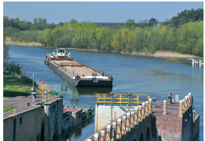
Photo 5. A barge-pusher assembly entering the lock in Biała Góra

The inland navigation fleet, built mostly in the 1970s, is obsolete, i.e. worn out technically and economically.