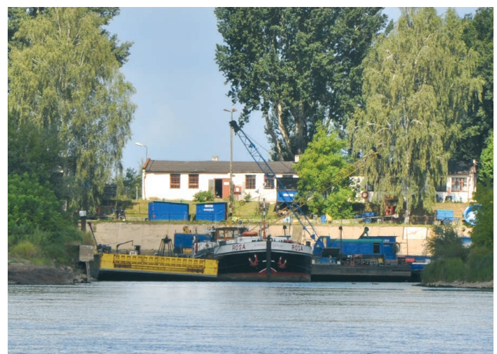
Photo 4. Inland port in Chełm (referred to as Fig. 2a)