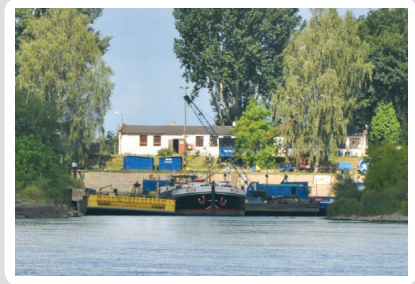
Fot. 4. Port śródlądowy w Chelmie

wykopany sztucznie, powierzchnia basenu portowego to ok. 5 ha, największa przystań barek i łodzi w Toruniu. Port AZS (Akademickiego Związku Sportowego) i Port Budowlani. Ogólna długość przeładunkowa nabrzeży w Toruniu wynosi 126 m; powierzchnia placów składowych 4000 m 2 , powierzchnia magazynów 1500 m 2 , a głębokość 5 m.