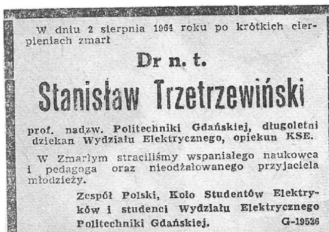
Rys. 6. Nekrolog od studentów Wydziału Elektrycznego PG