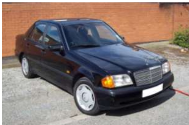
Rys. 1. Pojazd odpowiadający badanemu (przed kolizją) - Mercedes - Benz W202

Do przeprowadzenia pomiarów i obliczeń posłużył samochód osobowy marki Mercedes – Benz klasy C, model W202 z nadwoziem typu sedan (rys. 1). Wymiary pojazdu (długość x szerokość x wysokość): 4420 x 1678 x 1383 [mm], masa własna to 1150 [kg], rozstaw osi to: 2665 [mm].