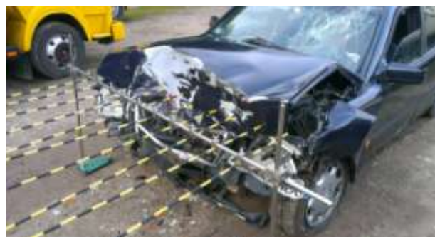
Rys. 3. Uszkodzenia pojazdu (lewa strona nadwozia)

Dane zebrane w tabeli 1 można przedstawić, jako profil odkształcenia czoła pojazdu (rys. 4).