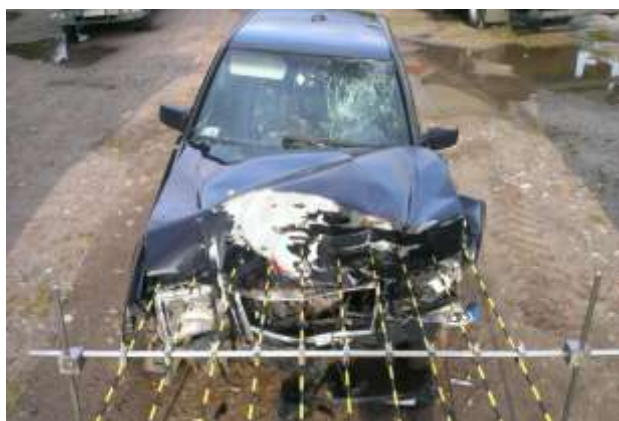
Rys. 2. Zakres uszkodzeń pojazdu badanego (widok od czoła)

Badany pojazd uległ zderzeniu czołowemu z innym pojazdem. Deformacji uległo czoło pojazdu, w tym: pokrywa silnika, pas przedni, podłużnice przednie, oraz błotniki przednie z obu stron. Na rysunkach 2 i 3 widoczny między innymi zakres uszkodzeń samochodu.