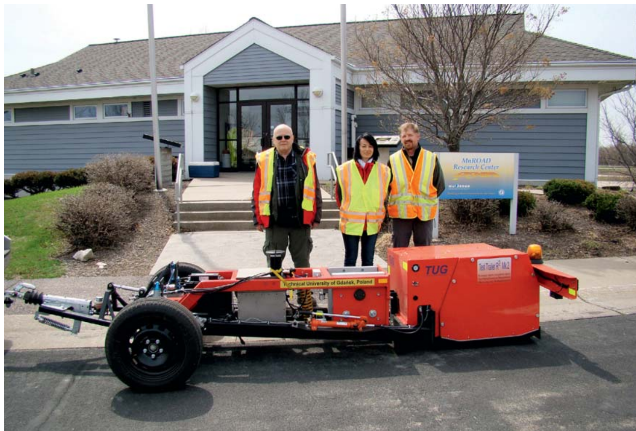
Rys. 7. Przyczepa do badania oporu toczenia R 2 Mk. 2 wraz z ekipą pomiarową podczas badań w MnRoad Facility w 2014 roku

► w 2013 roku (rys. 7). Badania w USA były pierwszym poważnym sprawdzeniem nowego urządzenia, co oczywiście powodowało spore emocje, bo w przypadku poważniejszej awarii naprawa na terenie USA mogła być bardzo trudna, a nawet całkowicie niemożliwa. Na szczęście przyczepa nie sprawiała kłopotów, za wyjątkiem zasilania w energię elektryczną z samochodu ciągnącego, który dostarczyli Amerykanie. Samochód nie miał odpowiednio wzmocnionej instalacji elektrycznej i konieczne było ciągnięcie dodatkowych przewodów od alternatora do tylnego zderzaka.