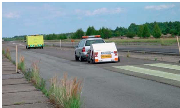
Rys. 2. Odcinki doświadczalne na opuszczonym lotnisku Sperenberg w Niemczech wykorzystywane kilkanaście lat temu do badań hałasu opon