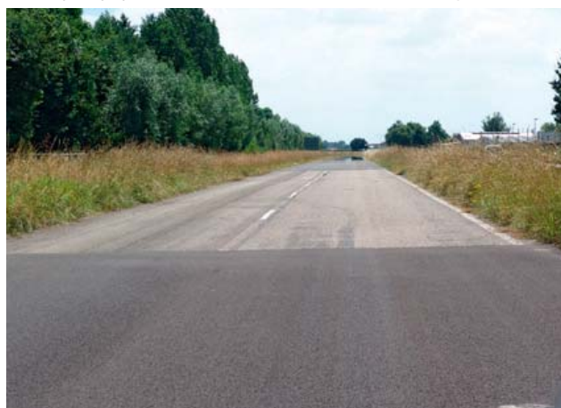
Rys. 3. Odcinki doświadczalne na wyłączonym z ruchu fragmencie drogi w miejscowości Kloosterzande, Holandia