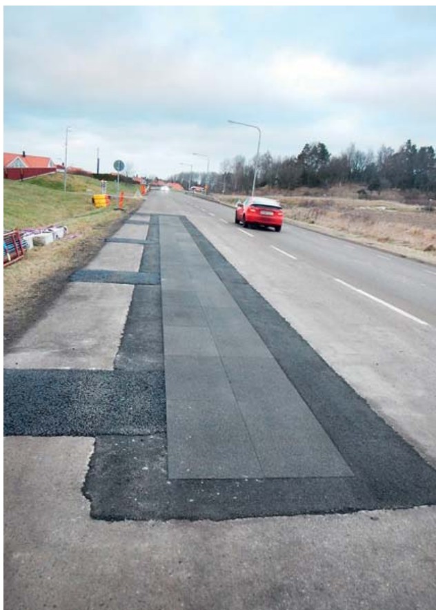
Rys. 1. Odcinek doświadczalny pokryty nawierzchnią poroelastyczną PERS-HET usytuowany na jednej z ulic w mieście Linköping, Szwecja