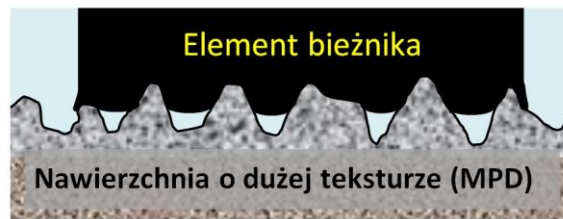
Rys. 1 Otulanie (" enveloping ") nawierzchni jezdni przez elementy bieżnika opony