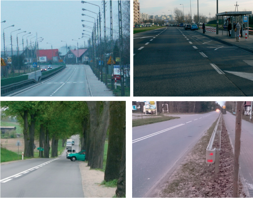
Rys. 1 Przykłady zagrożeń na sieci istniejących dróg

Konieczne jest zbudowanie szczegółowych modeli opisujących zależności miar bezpieczeństwa od wpływu wybranych elementów drogi i jej otoczenia, będących potencjalnym źródłem zagrożenia uczestników ruchu drogowego. Przykład takiej zależności – wpływ występowania drzew w pasie drogowym na gęstość wypadków GW na odcinkach dróg jednojezdniowych, przedstawiono na rys. 3 (przy założeniu średnich wartości dla pozostałych czynników wpływu na GW).