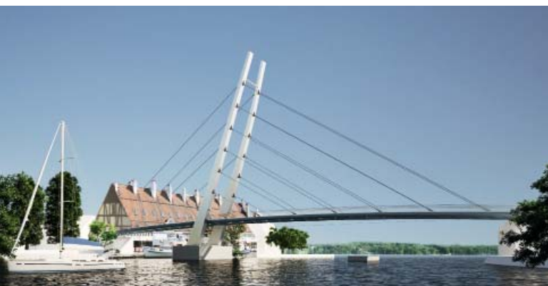
Rys. 1. Koncepcje nowej kładki