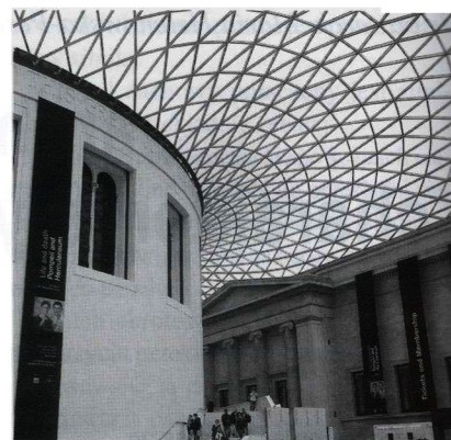
Fot. 4. Zadaszenie dziedzińca British Museum (proj. Foster and Partners, Buro Happold, 2000)

Projektowanie złożonych artefaktów o swobodnej geometrii zwykle odbywa się na bazie modeli parametryczno-algorytmicznych, które budowane są za pomocą technik skryptowych, tzn. algorytmów komputerowych napisanych