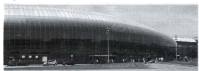
Fot. 1. Dworzec szybkiej kolei TGV, Strasburg (proj. RFR, 2007)

dworca kolejowego TGV w Strasburgu (fotografia 1).