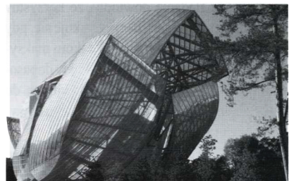
Fot. 2. Fundacja Louis Vuitton, Paryż (proj. F. Gehry, 2011) [ http://en.wikipedia.org/wiki/Louis_Vuitton_Foundation#/media/File:Fondation_Louis-Vuitton.JPG ]

Jednokierunkowe wygięcie szkła (powierzchni walcowej) uzyskuje się przez formowanie maszynowe. Zastosowanie takich paneli pozwala osiągnąć wizualną ciągłość odbić w pojedynczych pasmach (w jednym kierunku) za pomocą dopasowania krzywizny sąsiednich paneli. Budynek fundacji Louis Vuitton w Paryżu (fotografia 2) jest przykładem realizacji, której powłoka składa się z rodziny szklanych paneli jednokrzywiznowych giętych na gorąco, a następnie dodatkowo poddanych gięciu na zimno na miejscu