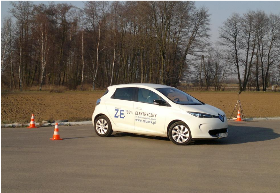
Rys. 1 Samochód Renault Zoe podczas badań mocy akustycznej związanej z manewrami parkowania