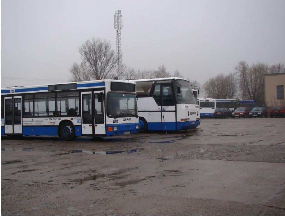
Rys. 3 Autobusy wykorzystywane do badań mocy akustycznej