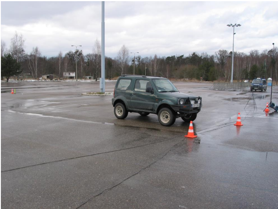
Rys. 2 Samochód Suzuki Jimny podczas badań mocy akustycznej związanej z manewrami parkowania