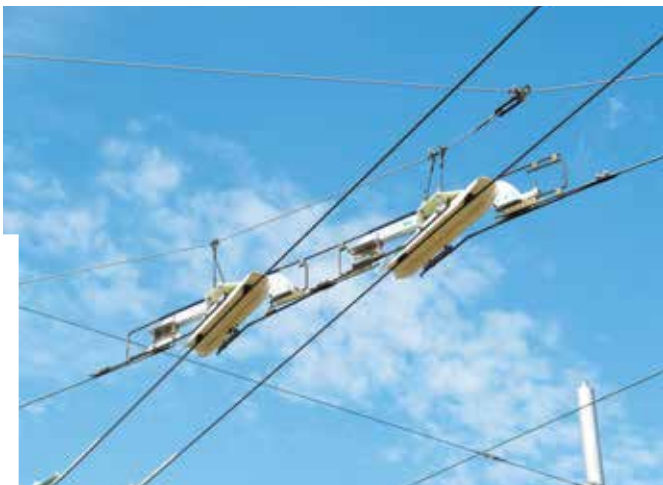
Fot. 2. Szybkoprzejezdne skrzyżowanie trolejbusowej i tramwajowej sieci trakcyjnej, Ostrava, Republika Czeska.

Alternatywnym rozwiązaniem jest zastosowanie podstacji trakcyjnych z rozdzielonym układem szyn zbiorczych (rys. 1). Wówczas rozdzielnia prądu stałego składa się z dwóch części, jednej zasilającej sieć trolejbusową, a drugiej – tramwajową. Każda z tych części jest zasilana z odrębnych zespołów prostownikowych. Rozwiązanie takie umożliwia zasilanie sieci w sposób izolowany. W wielu przypadkach stosuje się osobne podstacje dla celów zasilania trakcji trolejbusowej i tramwajowej; wówczas obydwa systemy są całkowicie niezależne.