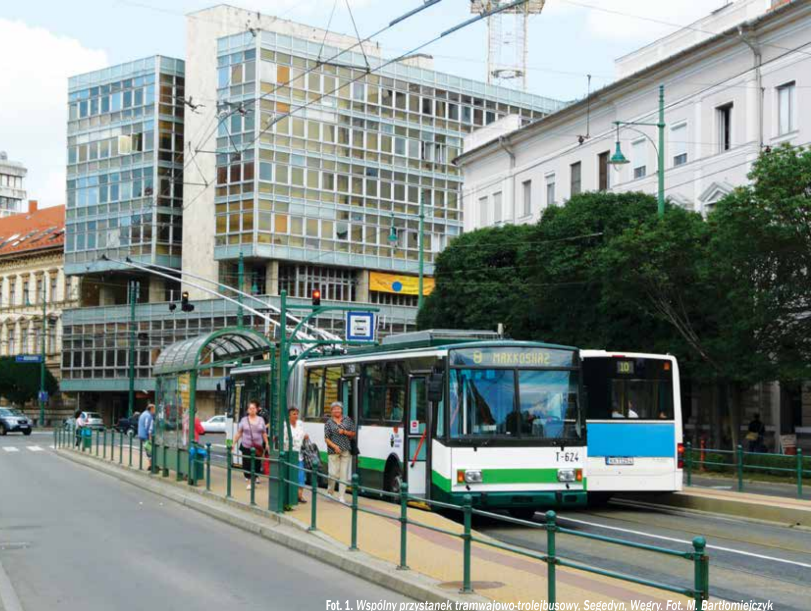
Fot. 1. Wspólny przystanek tramwajowo-trolejbusowy, Segedyn, Węgry.