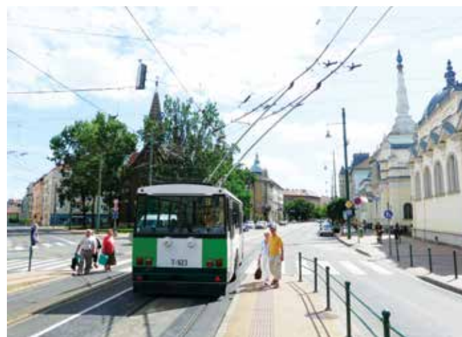
Fot. 5. Wspólny przystanek tramwajowo-trolejbusowy (Segedyn, Węgry): a) widoczne jest boczne zawieszenie sieci trakcyjnej, b) rozdzielenie się sieci trakcyjnej tramwajowej i trolejbusowej wraz ze skrzyżowaniem obydwu trakcji.