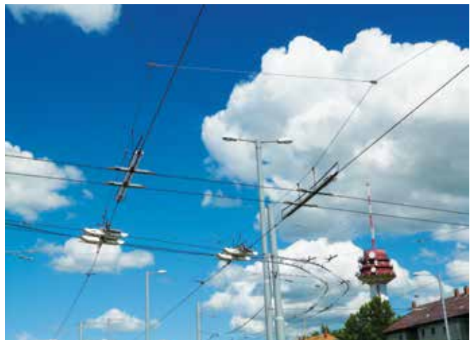
Fot. 3. Szybkoprzejezdne skrzyżowanie trolejbusowej i tramwajowej sieci trakcyjnej, Szeged, Węgry.