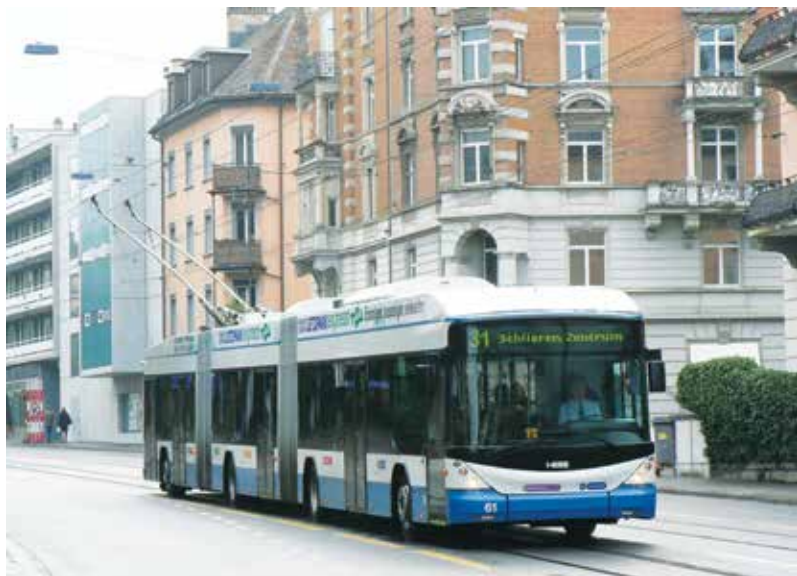
Fot. 4. Wspólny pas ruchu dla komunikacji tramwajowej i trolejbusowej, Zurich, Szwajcaria.

Pierwsze rozwiązanie jest zdecydowanie najtańsze, jednak obecnie – ze względu na kwestie ochrony przeciwporażeniowej – większość przedsiębiorstw stara się unikać zasilania obydwu systemów trakcji elektrycznej ze wspólnych szyn zbiorczych. Zastosowanie rozdzielnic o rozdzielonym układzie szyn zbiorczych zwiększa stopień ochrony pasażerów komunikacji trolejbusowej przed porażeniem prądem elektrycznym, ale także zwiększa nakłady finansowe związane z przebudową podstacji trakcyjnych. W licznych przypadkach (w obydwu wyżej wymienionych wariantach) koszty przebudowy podstacji trakcyjnych mogą być na tyle wysokie, iż uzasadnione będzie rozważenie budowy osobnych podstacji dla zasilania trakcji trolejbusowej. Wybór konkretnego rozwiązania jest uzależniony od lokalnych warunków i specyfiki istniejącego układu zasilania.