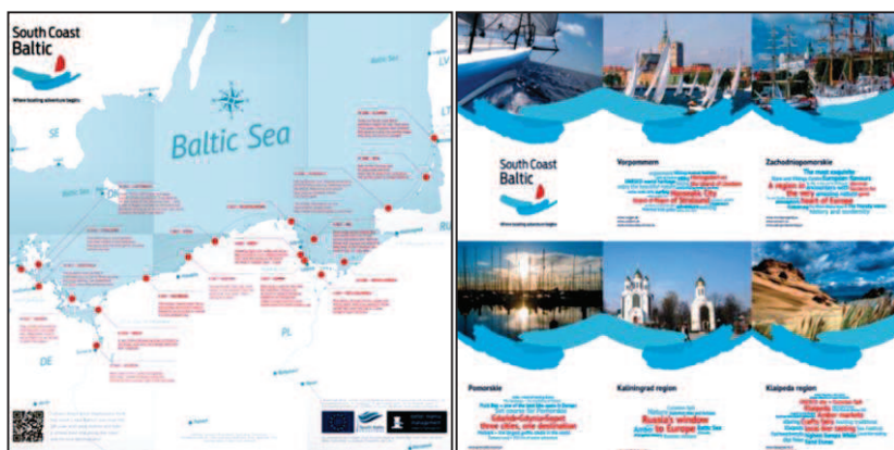
Rys. 2. Folder promocyjny South Coast Baltic

Folder promocyjny, składany do formatu kieszonkowego, jest podstawowym materiałem promującym markę South Coast Baltic 23 . Wewnętrzna strona folderu przedstawia propozycje siedemnastodniowego rejsu z Nidy (LT) do Lautrebach (DE), natomiast na okładce opisano pięć regionów południowego Bałtyku, podając dla każdego z nich charakterystyczne wyróżniki (rys. 2).