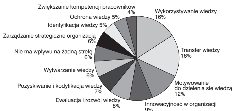
Rys. 2. Zestawienie (postrzeganego) łącznego wpływu wszystkich warstw intranetu na poszczególne sfery rozwoju zarządzania wiedzą i kapitału intelektualnego.

Rysunek 2 prezentuje zestawienie (na podstawie częstości deklarowania przez respondentów postrzeganego występowania danego powiązania) łącznego wpływu wszystkich czynników (we wszystkich ośmiu warstwach intranetu) na poszczególne sfery rozwoju zarządzania wiedzą i kapitału intelektualnego. Wyniki te określono poprzez zebranie wszystkich zaznaczonych czynników wchodzących w skład poszczególnych warstw.