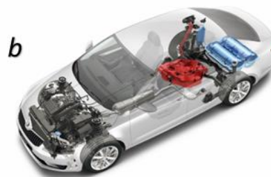
Rys. 1. Rozmieszczenie butli wysokociśnieniowych w autobusach (a) oraz pojazdach osobowych (b) [2]