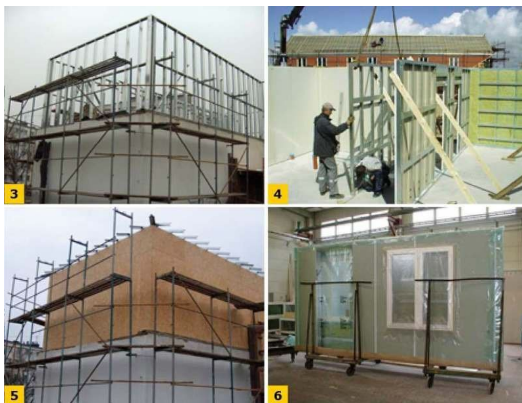
FOT. 3-6. Różne poziomy prefabrykacji: montaż z pojedynczych elementów (3), montaż gotowego szkieletu ściany (4), obudowanie szkieletu płytami OSB (5), prefabrykacja panelu ściennego (6); Fot. "Systemy suchych konstrukcji stalowych w budownictwie", Materiały vol. 6. Warszawa 2006

Wybrane przykłady przedstawiają FOT. 3-6.