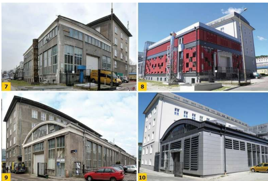
FOT. 7-10. Budynek hali warsztatowo-laboratoryjnej powstały w latach 50. ubiegłego wieku: przed renowacją (7, 9), po renowacji w 2015 r. (8, 10)