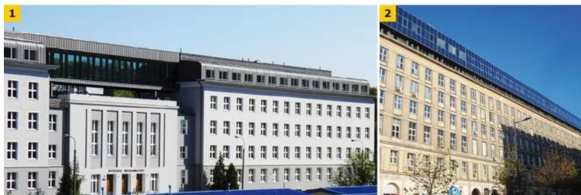
FOT. 1-2. Przykłady zrealizowanych nadbudów obiektów: budynek kampusu Politechniki Gdańskiej (1), budynek użyteczności publicznej - Warszawa, ul. Świętokrzyska (2)