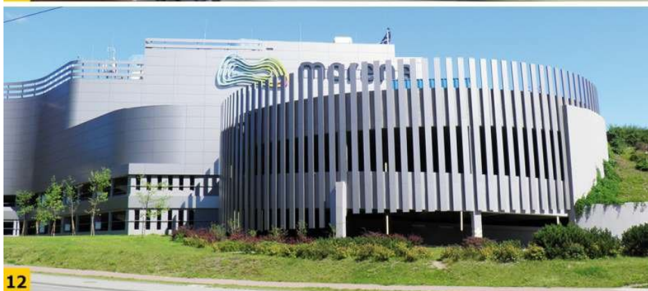
• FOT. 11-12. Centrum handlowe powstałe około 2003 r.: obiekt przed przebudową (11), obiekt po rozbudowie i renowacji elewacji w latach 2015-2016 (12)