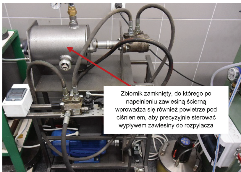
Rys. 3. Zamknięty zbiornik z zawiesziną ścierną wraz z mieszałem

Zbiornik zamknięty, do którego po napełnieniu zawiesziną ścierną wprowadza się również powietrze pod ciśnieniem, aby precyzyjnie sterować wypływem zawiesziny do rozpylacza