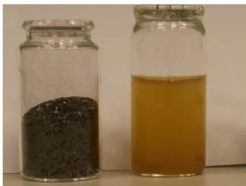
Płatki grafitowe (po lewej) oraz zawiesina tlenku grafenu (po prawej).