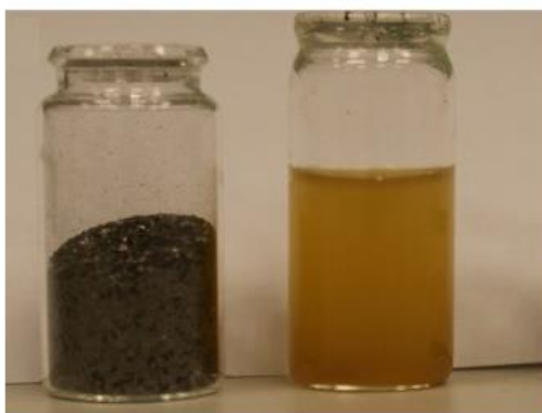
Płatki grafitowe (po lewej) oraz zawiesina tlenku grafenu (po prawej).