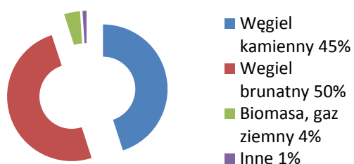
Rys. 1. Możliwości produkcji wodoru w Polsce (100% = 37 mln ton/rok)

Taka konstrukcja umożliwia dopasowanie zdolności produkcyjnych wodoru do potrzeb, jednak ogranicza korzyści z efektu skali, bo nawet duże elektrolizery zawierają komórki i stosy o identycznej średnicy.