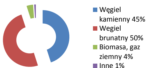
Rys. 1. Możliwości produkcji wodoru w Polsce (100% = 37 mln ton/rok)

Taka konstrukcja umożliwia dopasowanie zdolności produkcyjnych wodoru do potrzeb, jednak ogranicza korzyści z efektu skali, bo nawet duże elektrolizery zawierają komórki i stosy o identycznej średnicy.