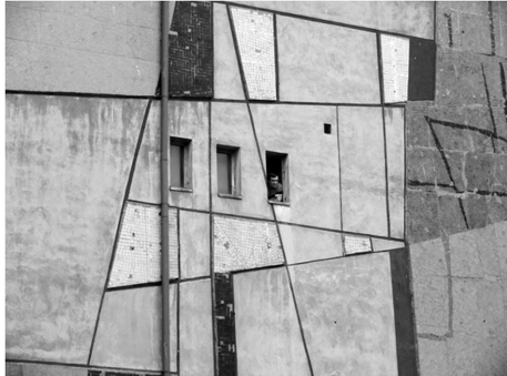
Fot. 3. Mozaika Anny Fiszer (fragment)