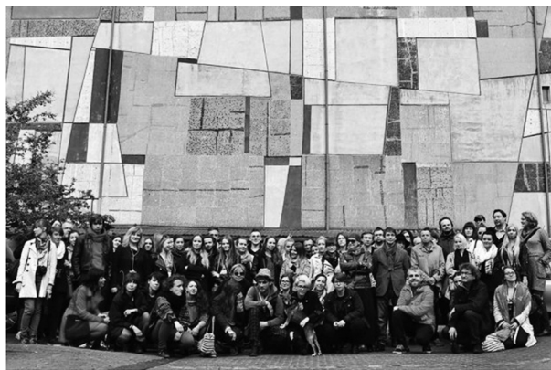
Fot. 5. Grupa obrońców mozaiki