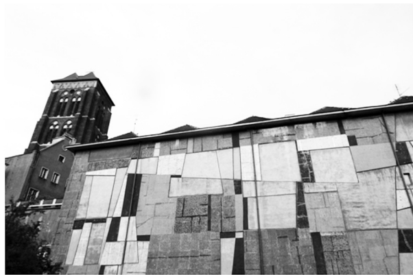
Fot. 2. Mozaika Anny Fiszer (fragment)