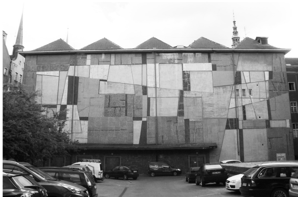
Fot. 1. Mozaika Anny Fiszer