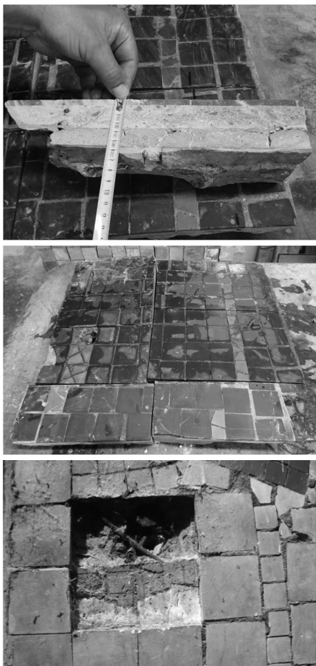
Fot. 6-8. Ekspertyza mozaiki Anny Fiszer (fot. 6-8).

została) została przymocowana do ściany punktowo za pomocą długich gwoździ wbitych w spoinę muru [Wilde et al. 2015] (fot. 6-8).