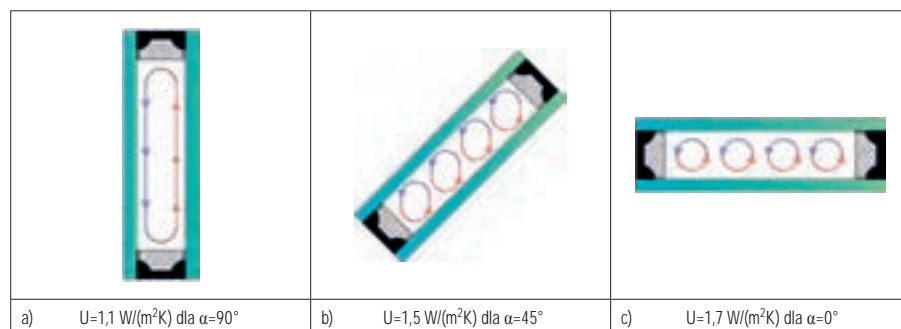
Rys. 1. Zmiany sposobu cyrkulacji gazów w strefie międzyszybowej a współczynnik U