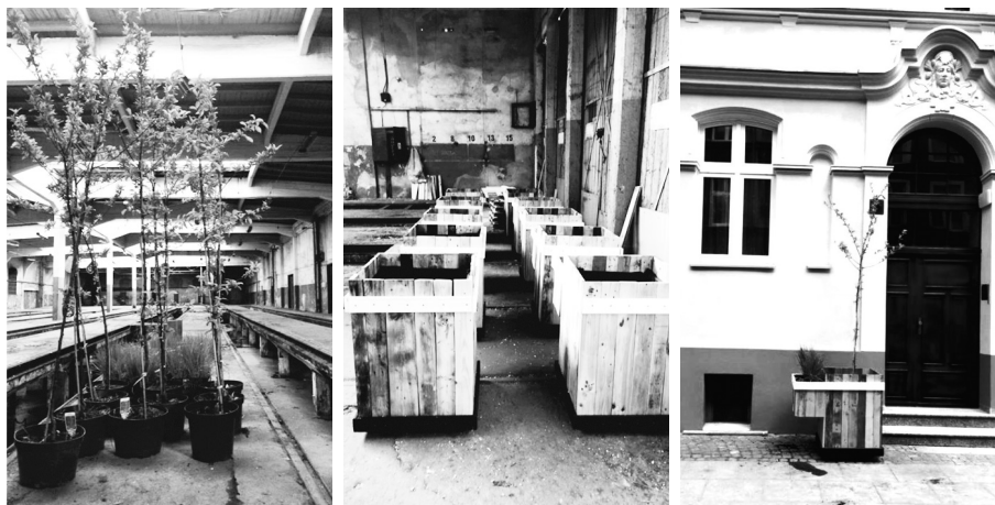
Fot. 5. Donice na jabłunki i trawy ozdobne, będące efektem pracy mieszkańców Dolnego Miasta w ramach projektu „Zielona Zielona”

Efekty opisywanej wspólnej pracy zostały przedstawione w trakcie pikniku ogólnodzielnicowego. W tym szczególnym dniu ulica Zielona i jej najbliższe otoczenie otworzyły się nie tylko dla swoich mieszkańców, ale każdego, kto chciał poznać historię i walory tego miejsca. Zorganizowane zostały spacerki tematyczne, wystawa pozyskanych w trakcie projektu fotografii archiwalnych, dzielnicowy pchli targ oraz nocna projekcja animacji stworzonych przez uczestników warsztatów multimedialnych i związanych z lokalną historią. Wybudo-