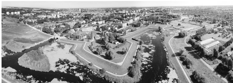
Fot. 1. Widok z lotu ptaka na Dolne Miasto w Gdańsku