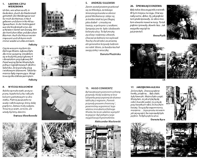
Fot. 3. Fragmenty przewodnika po Dolnym Mieście w Gdańsku wydanego w ramach projektu „Ścieżki żywej pamięci”