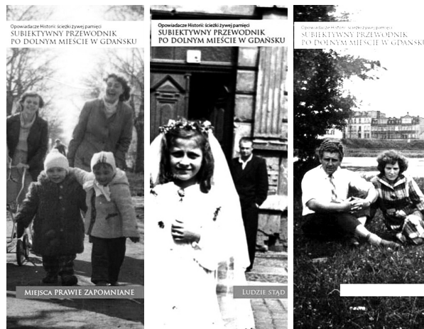
Fot. 2. Okładki trzech subiektywnych przewodników po Dolnym Mieście w Gdańsku wydanych w ramach projektu „Ścieżki żywej pamięci”