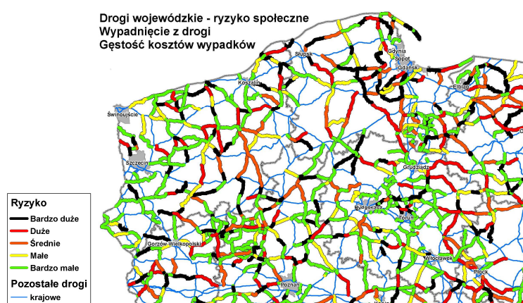
Rys. 2. Mapa odcinków dróg woj., ryzyko społeczne, wypadnięcia z jezdni

W przyjętej klasyfikacji poziomu bezpieczeństwa ruchu proponuje się pięć klas potencjału redukcji kosztów wypadków na odcinkach dróg (A, B, C, D, E) [3]. Pomimo, że klasyfikacja odcinków niebezpiecznych dotyczy obligatoryjnie tylko dróg krajowych, w roku 2015 opracowano na zlecenie Krajowej Rady BRD, klasyfikację odcinków niebezpiecznych dla dróg wojewódzkich [6]. Na rys. 2 przedstawiono, jako przykład takiej klasyfikacji, ryzyko społeczne (gęstość kosztów wypadków) dla wypadków typu wypadnięcie z drogi.