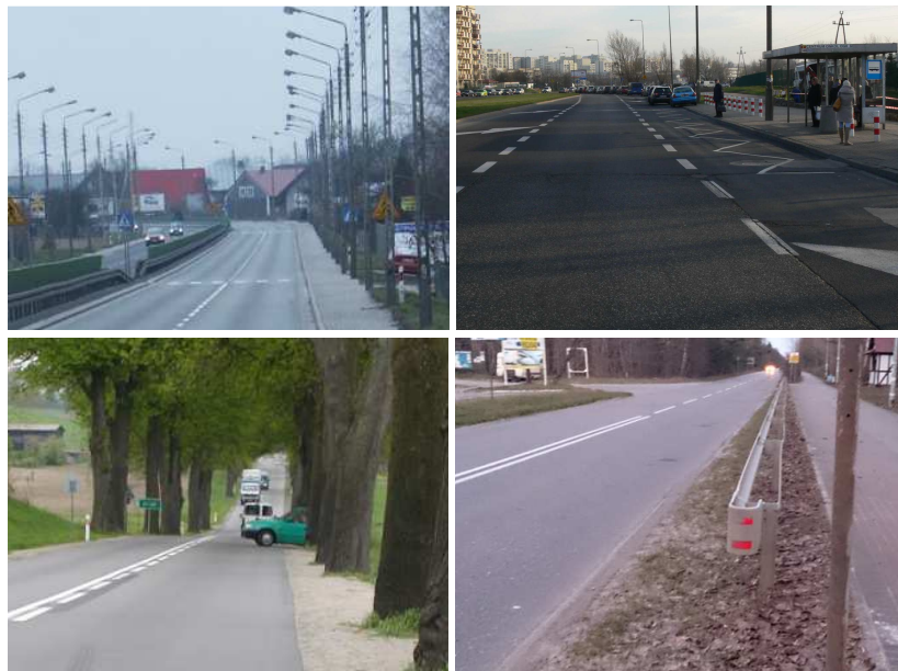
Rys. 3. Przykłady zagrożeń na sieci istniejących dróg

C – duże zagrożenie). Obecnie trwają prace nad przyjęciem obiektywnych miar oceny zagrożenia na drogach, konieczne jest określenie wpływu prędkości i natężenia ruchu drogowego na klasę zagrożenia. Efektem prowadzonych badań będzie narzędzie umożliwiające obiektywne klasyfikowanie identyfikowanych podczas kontroli zagrożeń na drodze i w jej otoczeniu.