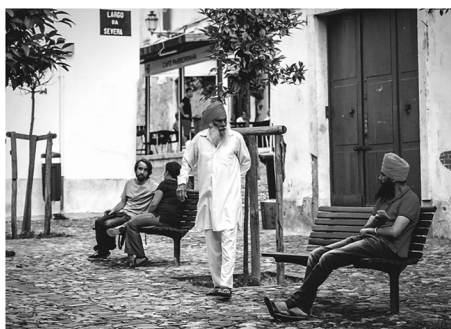
Fot. 3. Nowe zagospodarowanie skweru Largo da Severa. Wprowadzenie zieleni i elementów umeblovania przestrzeni publicznej zostało bardzo dobrze przyjęte przez mieszkańców dzielnicy

Ankieta przeprowadzona przez Bettencourt i Castro na próbie 22 osób, składającej się z 14 „tradycyjnych” mieszkańców, 6 „nowych” mieszkańców nazwanych gentryfiers oraz 2 imigrantów [Bettencourt, Castro 2015] pokazuje, że silnie odczuwalna jest niewystarczająca, w opinii mieszkańców, konsultacja miasta w kwestii założeń projektu i działań rehabilitacyjnych, co sprawia, że nie czują się oni w dużej mierze adresatami wprowadzanych zmian. Widoczna postępująca gentryfikacja oraz zwiększona liczba biznesów prowadzonych przez imigrantów budzi wśród ankietowanych obawy dotyczące utraty tradycyjnej tożsamości dzielnicy. Ankieta przeprowadzona przez autorkę na potrzeby prezentowanego opracowania na próbie 49 osób (21 pochodzenia portugalskiego, 28 imigrantów) pokazuje również duże zróżnicowanie w odbiorze prowadzonych działań – jakkolwiek kierowanie oficjalnej tożsamości dzielnicy w stronę związaną z tradycją fado jest bardzo dobrze odbierane, pozostałe działania są odbierane w sposób zdecydowanie bardziej negatywny wśród starszej