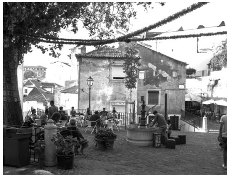
Fot. 1. Largo dos Trigueiros, przy fontannie ogólnodostępny regał z książkami i miejsce do czytania