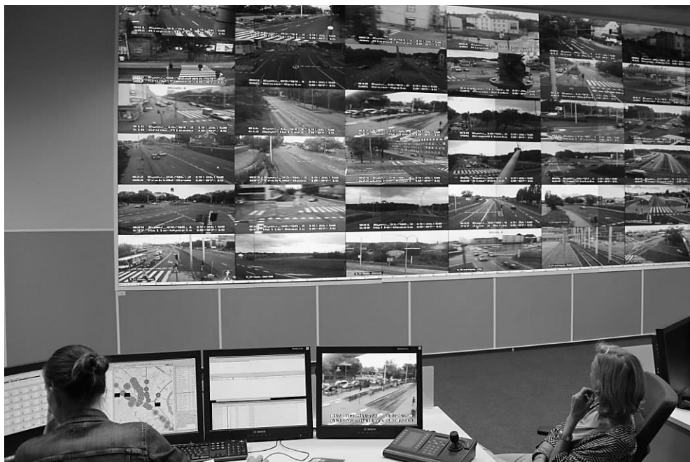
Fot. 1. Sala operatorska w Centrum Zarządzania Ruchem Systemu TRISTAR w Gdańsku

System TRISTAR jest obsługiwany przez dwa obszarowe centra zarządzania, połączone szybkim łączem światłowodowym: centrum w Gdyni obejmuje Gdynię, a centrum w Gdańsku – Sopot i Gdańsk (por. fot. 1). Zarządzanie ruchem na obszarze Trójmiasta z każdego centrum jest zależnie od kompetencji określonego operatora. Dane o ruchu dotyczące całego Trójmiasta są gromadzone w centralnej bazie danych – tzw. hurtowni danych.