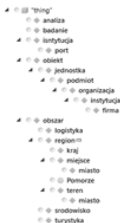
Rysunek 4. Przykład układania relacji w analizie decyzyjnej

ich rezultatów jako bytów współistniejących. W przypadku opracowań zbioru słów mającego wchodzić w skład ontologii, zastosowana metoda wyszukiwała zwrotów w dwóch dokumentach: bazowym, czyli wzorze wniosku projektowego (opracowanym ekspercko) oraz jednym, wybranym z dostarczonej próby 20 wniosków projektowych. Następnie zwroty zostały porównane parami w każdym z dokumentów, przy wyszukiwaniu tych, których powtarzalność była większa niż dwa. Pozwoliło to na zbudowanie bazy 200 słów i zwrotów, która stała się wyjściową do opracowania drzewa ontologii. Kolejny krok zakłada opracowanie relacji, czyli „stosunku lub zależność między (...) pojęciami” (Słownik języka polskiego PWN, 2011). Etap ten wymaga największych nakładów pracy, dlatego warto skorzystać z dostępnych narzędzi wspierających budowę ontologii – fragment modelu ontologii utworzonego z wykorzystaniem programu Fluent Editor został przedstawiony na rysunku 4.