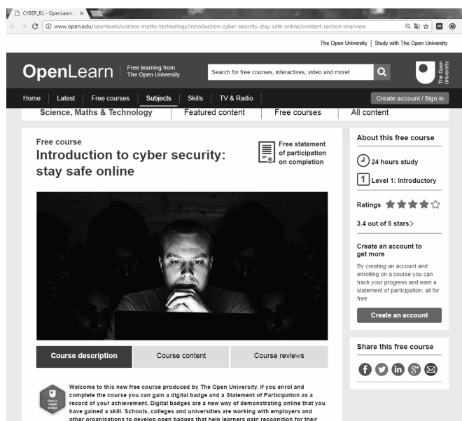
Rys. 2. Strona początkowa masowego kursu otwartego „Wprowadzenie do cyberbezpieczeństwa: bądź bezpieczny online” opracowanego w Wielkiej Brytanii.

Masowe kursy online mogą stać się ciekawą ścieżką kształcenia w dziedzinie bezpieczeństwa sieci i informacji. Do tego stopnia, że Wielka Brytania wprowadziła je do swojej Narodowej Strategii Cyberbezpieczeństwa, gdzie zapisano, że rząd Wielkiej Brytanii koordynuje utworzenie kursu cyberbezpieczeństwa. Kurs ten powstał w 2014, a w roku ubiegłym pojawiła się jego uaktualniona wersja „Wprowadzenie do cyberbezpieczeństwa: bądź bezpieczny online” (rys. 2) zawierająca m.in. poprawione zadania sprawdzające wiedzę [24]. Kurs ma na celu wyjaśnienie zagadnień bezpieczeństwa online i przedstawienie podstawowych technik ochrony. Nie wymaga posiadania wcześniejszej wiedzy z zakresu cyberbezpieczeństwa, przewidziany jest na 8 tygodni, po 3 godziny tygodniowo, a po jego uzyskaniu otrzymuje się cyfrową odznakę ułatwiającą potencjalnym pracodawcom rozpoznanie umiejętności kandydata. Kurs jest całkowicie bezpłatny [24]. Oprócz kursu podstawowego rząd brytyjski wsparł stworzenie tematycznych kursów dla biznesu, dedykowanych konkretnym rodzajom przedsiębiorstw, czy grupom pracowników [25]. Podobne inicjatywy popierane są przez Komisję Europejską. W 2013 roku powstała europejska platforma kursów masowych OpenUpEd, która obecnie oferuje ponad 200 szkoleń.