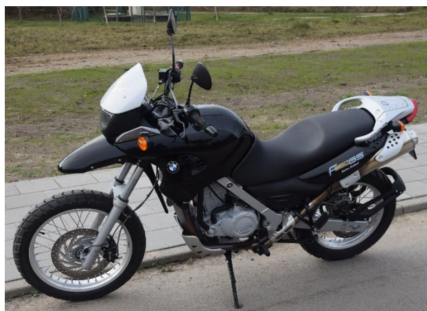
Rys. 1. Motocykl BMW F650 GS użyty w badaniach

Serię prób ekstremalnego hamowania wykonano motocyklem BMW F650 GS, rok produkcji 2003 (rys. 1 i rys. 2). Masa motocykla w stanie gotowym do badań z kierowcą wynosiła ok. 270 kg. Założone były opony szosowe o zalecanym przez producenta ciśnieniu powietrza. Wymiary: długość 2280 mm, szerokość 890 mm, wysokość 1240 mm. Pojemność skokowa silnika 652 cm 3 i moc maksymalna 37 kW przy 6500 obr/min. Motocykl fabrycznie wyposażony w układ ABS BMW Motorrad, który można było włączyć lub wyłączyć przyciskiem znajdującym się przy kierownicy. Hamulec przedniego koła uruchamiany pompą hamulcową umieszczoną na kierownicy. Z przodu zamontowana została pojedyncza tarcza hamulcowa o średnicy 300 mm oraz pływający zacisk dwutłoczkowy (rys.3). natomiast układ hamulcowy tylnego koła wyposażony został w tarczę hamulcową o średnicy 265 mm i pływający zacisk jednołoczkowy. Pompa hamulcowa umieszczona została pionowo przy prawym podnóżku.