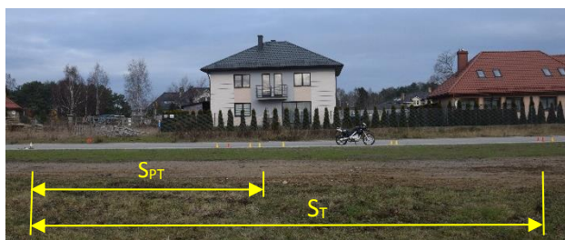
Rys. 4 Widok drogi intensywnego hamowania motocykla.

Na rys. 4 i 5 przedstawiono orientacyjne drogi hamowania motocykla BMW przy intensywnym hamowaniu samym hamulcem tylnym (S T ) i obydwo hamulcami łącznie (S P T).