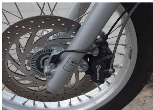
Rys. 3. Widok układu hamulcowego przedniego koła motocykla BMW F650 GS z układem ABS