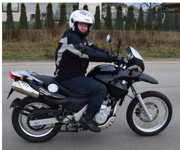
Rys. 2. Użyty w badaniach motocykl BMW F650 GS wraz z doświadczonym kierowcą podczas próby hamowania