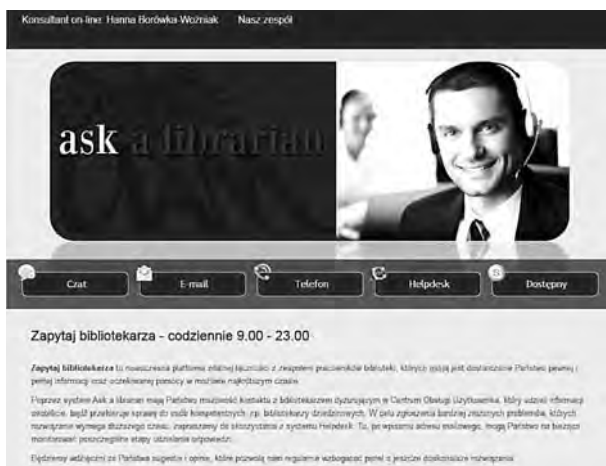
Serwis Ask a librarian Biblioteki Uniwersyteckiej w Poznaniu

Użytkownik komunikuje się z biblioteką już nie tylko za pomocą komputera, ale również za pośrednictwem urządzeń mobilnych, takich jak smartfony czy tablety.