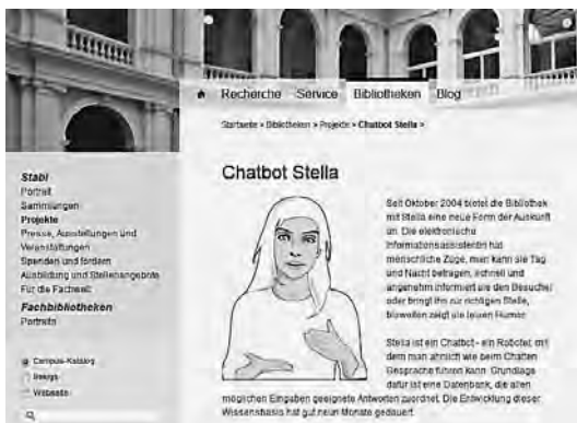
Chatbot Stella Biblioteki Uniwersyteckiej w Hamburgu