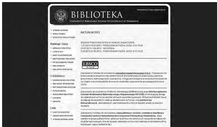
Właściwe rozmieszczenie elementów na stronie WWW