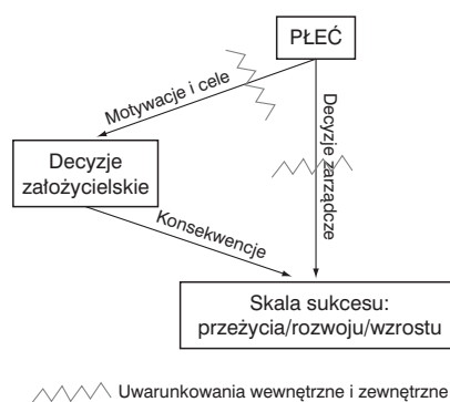
Rys. 1. Wpływ płci na działania przedsiębiorcze.

Na podstawie dotychczasowych rozważań zaproponowano model badawczy wskazujący na dużą rolę uwarunkowań wewnętrznych i zewnętrznych, które wpływają zarówno na motywacje oraz cele biznesowe, jak i na funkcjonowanie założonych przez kobiety firm (rysunek 1). Model ten wskazuje na wpływ płci, a dokładnie motywacji oraz celów, jakimi kierują się kobiety, na decyzje założycielskie. Zakłada się, że motywacje oraz cele powodują, że otwierane przez kobiety firmy są mniejsze, a wartość zaangażowanego kapitału niższa. Ponadto, jak wynika z analiz, kobiety prowadzą działalność w sektorach nisko kapitałowych (usługi socjalne, zdrowotne, edukacyjne), co jednak powoduje także niższą stopę zysku (European Commission, 2014), czyli są to firmy zlokalizowane w domu, co ogranicza możliwości zwiększania zatrudnienia. To wszystko z kolei determinuje dalsze funkcjonowanie tych firm. Zarówno motywacje, jak i cele są kształtowane przez uwarunkowania wewnętrzne oraz zewnętrzne, o czym już wspomniano. W modelu uwzględniono także wpływ płci na skalę sukcesu (nie analizowano, czym ten sukces ma się przejawiać – stopą przeżycia, rozwoju tudzież wzrostu), przy czym – podobnie jak w przypadku decyzji założycielskich – zakłada się, że decyzje zarządcze są także kształtowane w dużym stopniu przez uwarunkowania wewnętrzne i zewnętrzne.