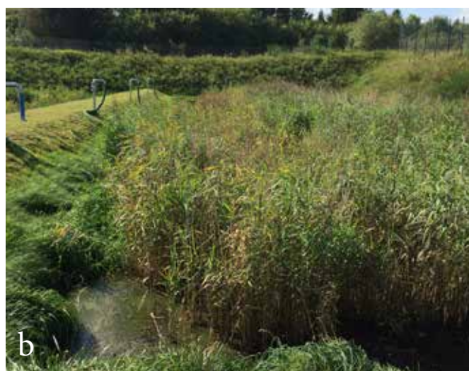
Rys. 8.2. Obiekty trzcinowe (STRB): a) rzut z góry na oczyszczalnię w Helsingørze (Dania), b) złoża trzcinowe w Gniewinie (Polska); źródła: Nielsen (2003), fotografia własna