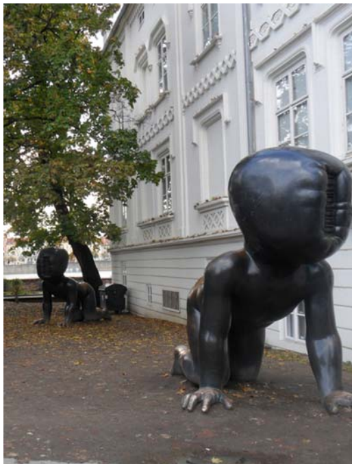
Fig. 9. Infants by David Černy in the Kampa park in Prague.

Ryc. 8. Mimininka autorstwa Davida Černego – Wieża telewizyjna Žižkov w Pradze.