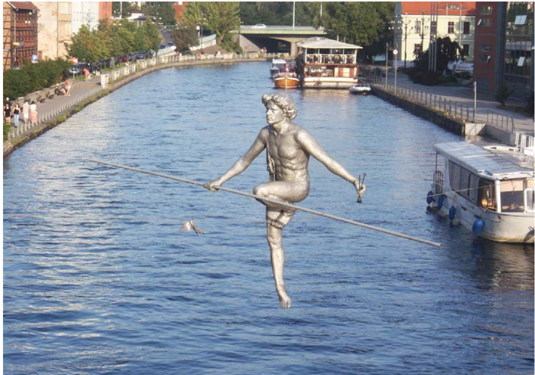
Fig. 12. Crossing the river by Jerzy Kędzior. Source: author

Ryc. 12. Przechodzący przez rzekę autorstwa Jerzego Kędziora. Źródło: autor