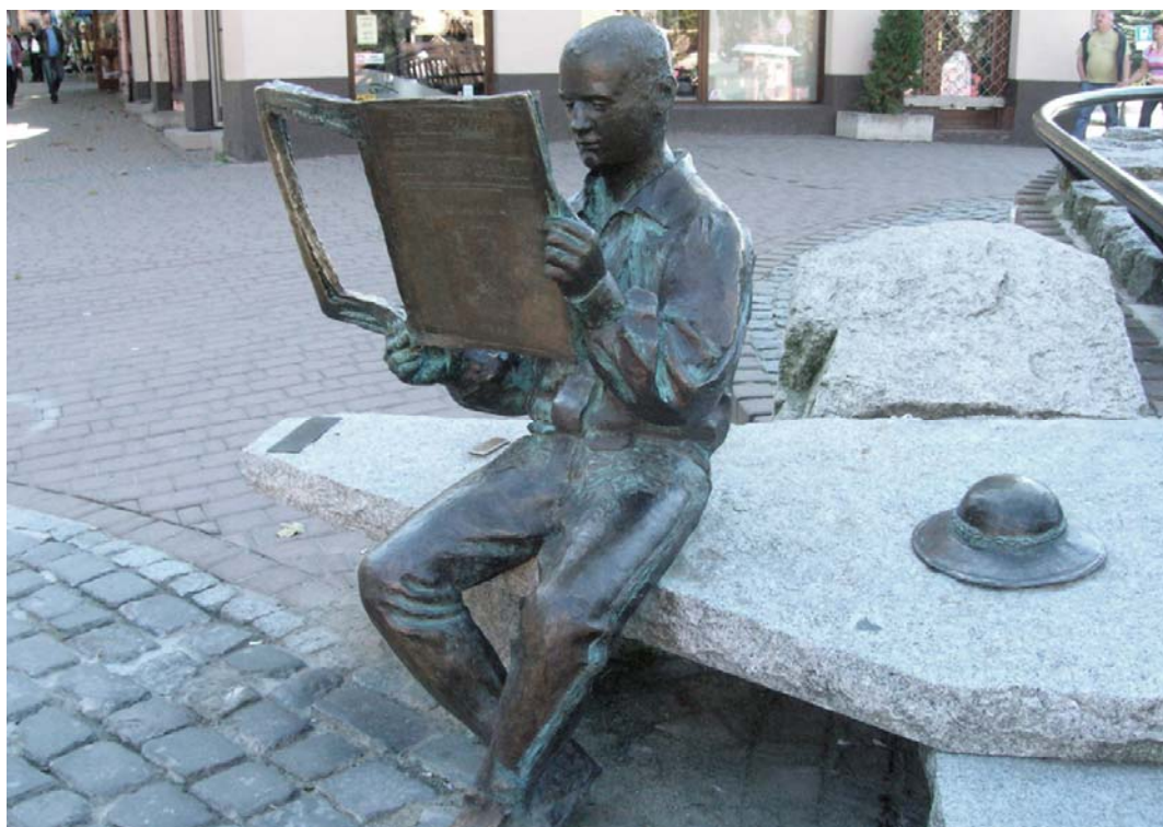
Fig. 11. Reader from Zakopane, by Karol Gąsienica Szostak.

Passing through the river by Jerzy Kędzior (Fig. 11) is a sculpture commemorating Poland's accession to the European Union. It was suspended on a line stretched between the banks of the Brda river on May 1, 2004. The sculpture depicts a young man holding an arrow in one hand and a perch in second. Over his shoulder, he is overlaid with sandals - the same as those worn by the Bydgoszcz Archers . Because of the same footwear and man-made arrows - this figure connects well with the symbol of the city of Bydgoszcz - the Archer . The statue has another hidden information - a swallow sitting on a perch - from German language: 'schwalbe' - the name of the founder of the Pomeranian Philharmonic [12]. The sculpture stands in beautiful scenery - you can see it from the bank of the river or from the bridge. It presents itself equally well during the day as well as during the night. This is mainly possible thanks to the well chosen location and all the care that was taken by the city authorities to install good lightings for the monument. Since the Passing through the river appeared, it is increasingly noticeable to see visitors and locals stopping for a moment at this place. The sculpture gained a general sympathy of the inhabitants of Bydgoszcz and it was incorporated into the urban tissue in a really smooth manner.