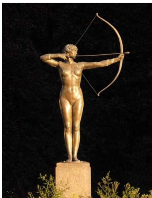
Fig. 2. The Archer from 1908 by Ferdinand Lepcke.

Ryc. 2. Łuczniczka z 1908 roku autorstwa Ferdynanda Lepckego.