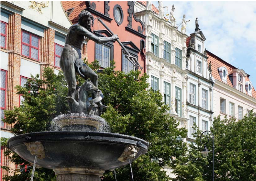
Fig. 4. The Neptune Fountain in Gdańsk by Abraham van den Blocke.

Sculptures are also performing additional functions like the aestheticization of space or being a symbol of the city. An example of such a monument may be the Neptune Fountain in Gdańsk (Fig. 4) – designed by Abraham van den Blocke. The statue was cast in 1615, and the trellis with golden coats of Gdansk and Polish eagles dates back to 1634 [10]. The fountain was positioned in such a way that each side had a suitable background. When standing in front of Neptune, behind it, we see the façade of Artus Court. When looking at it from the Green Gate - the fountain has the Town Hall of the City in the background. When looking at it from the Długa street, it has the Royal Road in the background. It is a monument strongly integrated into the town's urban fabric. An indispensable element of Gdansk, attracting many tourists.