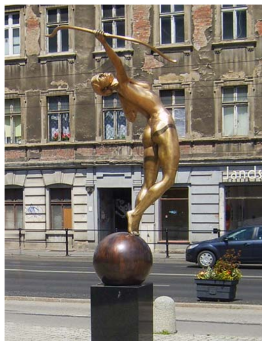
Fig. 3. The Archer from 2013 by Maciej Jagodziński-Jagenmeer. Source: author

Ryc. 2. Łuczniczka z 1908 roku autorstwa Ferdynanda Lepckego. Źródło: [13]