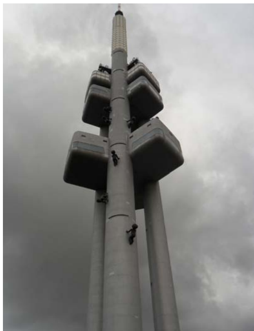
Fig. 8. Mimininka by David Čern - TV Tower Žižkov in Prague.

There are monuments that are strongly linked to the emerging social problems – often provocative, met with really low social reception, sometimes emotional and sometimes trying to encourage to hold a specific stand on a given issue.