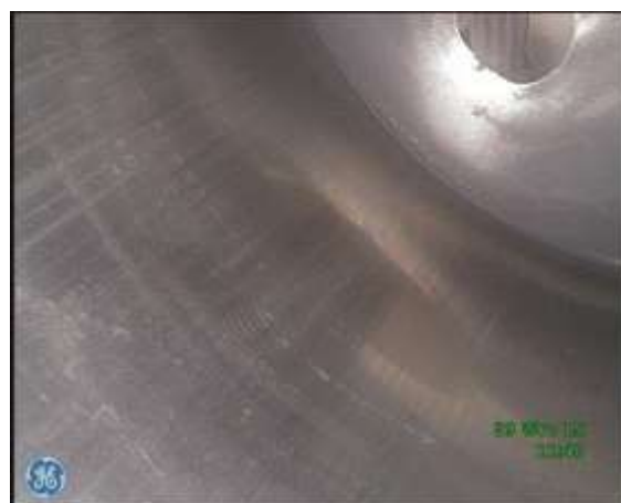
f) Gładz cylindrowa w rejonie GMP - ślady zużycia ściernego, brak śladów "honowania" tulei