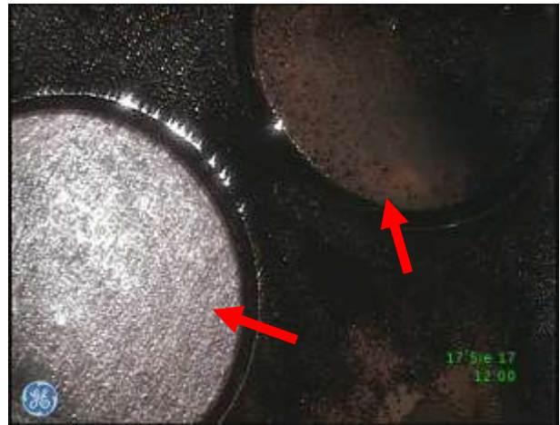
d) Zawory cylindrowe w dolnej płycie głowicy