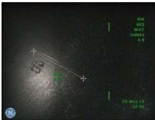
c) Pomiar długości rysy na denku tłoka wykonany metodą „Cienia” - 7,52 mm z indeksem dokładności 4.9, co odpowiada błędowi bezwzględnemu rzędu 0,3 mm