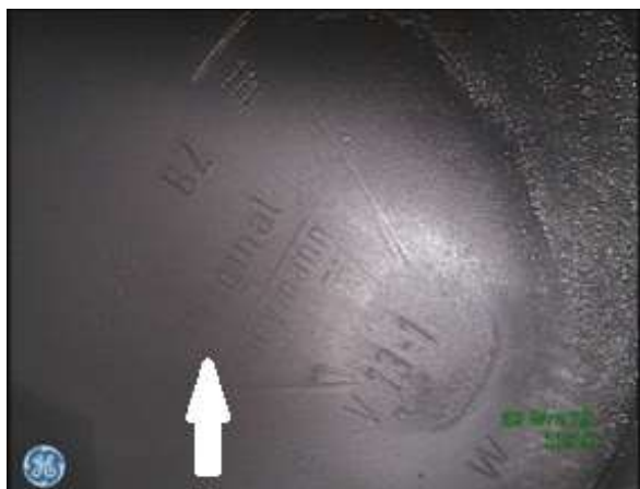
a) Denko tłoka z numerem identyfikacyjnym