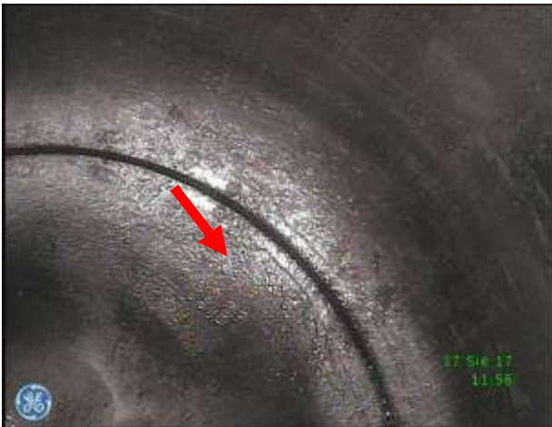
c) Przestrzeń robocza w rejonie DMP tłoka – nieznaczne osady zanieczyszczeń na denku tłoka