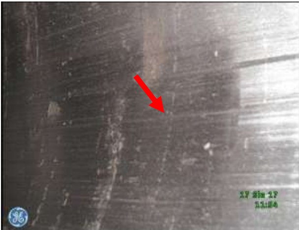
a) Gładź cylindrowa w części środkowej tulei - ślady zużycia ściernego, brak śladów "honowania" tulei