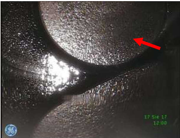
c) Gniazdo zaworu dolotowego w dolnej płycie głowicy