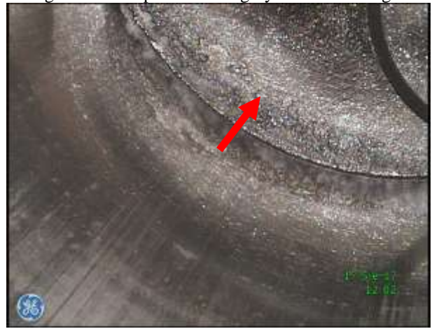
d) Przestrzeń robocza w rejonie GMP tłoka – osady nagaru na dolnej płycie głowicy