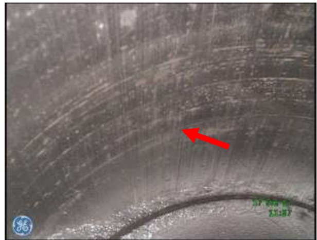
f) Gładź cylindrowa w rejonie DMP - ślady zużycia ściernego, brak śladów "honowania" tulei