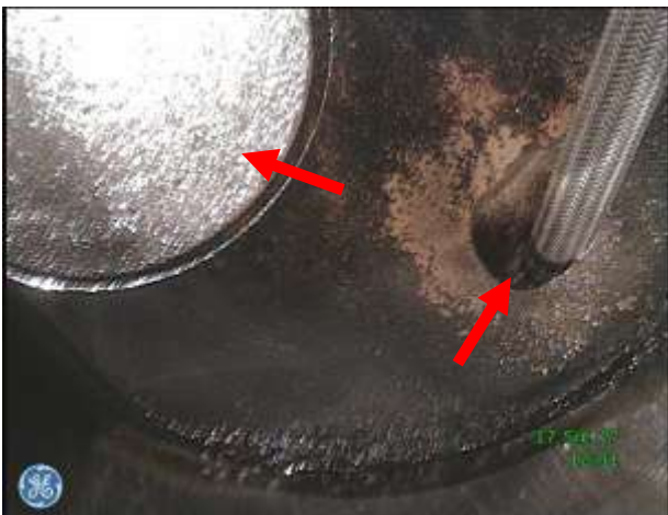
e) Dolna płyta głowicy, zawór dolotowy – sonda inspekcyjna wprowadzona przez otwór po zdemontowanym wtryskiwaczu