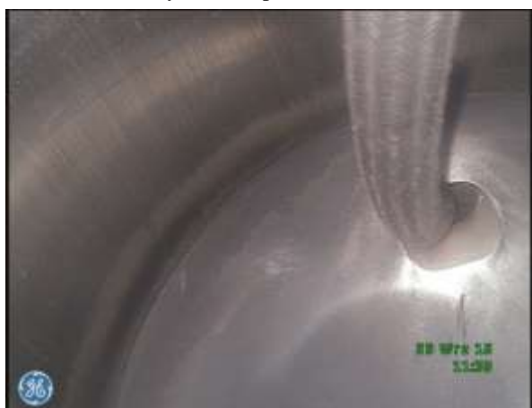
e) Dolna płyta głowicy – sonda inspekcyjna wprowadzona przez otwór po zdemontowanym wtryskiwaczu paliwa