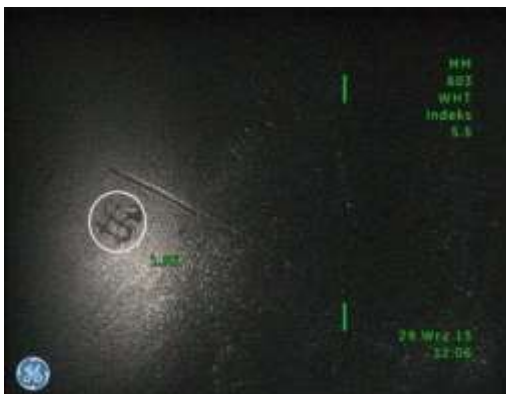
e) Przymiar kołowy oznaczenia wybitego na denku tłoka wykonany metodą „Cienia” - 1,96 mm z indeksem dokładności 5,5, co odpowiada błędowi bezwzględnemu rzędu 0,25 mm