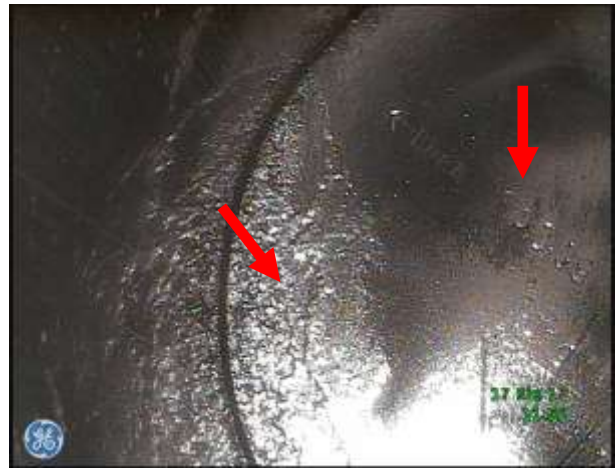
d) Denko tłoka – nieznaczne osady zanieczyszczeń, widoczny numer identyfikacyjny (katalogowy)