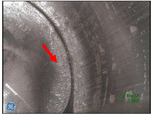
b) Przestrzeń robocza w rejonie DMP tłoka – nieznaczne osady zanieczyszczeń na denku tłoka