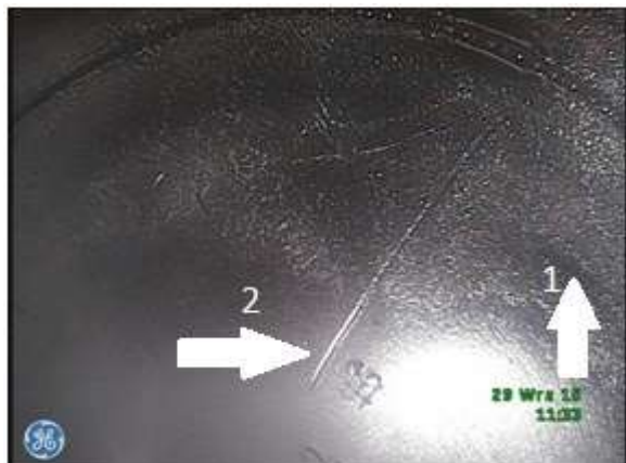
c) Denko tłoka - widoczne ślady nagaru (1) oraz zarysowanie powierzchni (2)