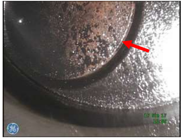
b) Gniazdo zaworu wylotowego w dolnej płycie głowicy