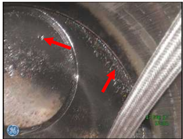
f) Dolna płyta głowicy, zawór wylotowy – nieznaczne osady zanieczyszczeń, nieznaczne wgniecenie na powierzchni grzybka zaworowego