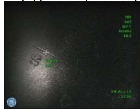
b) Pomiar głębokości rysy na denku tłoka wykonany metodą „Cienia” - 0,35 mm z indeksem dokładności 16.3 odpowiadającemu błędowi bezwzględnemu rzędu 0,1 mm