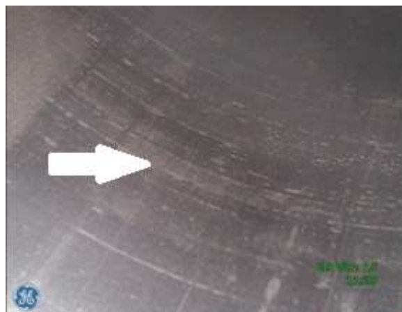
b) Gładz cylindrowa w rejonie DMP - ślady zużycia ściernego, brak śladów "honowania" tulei