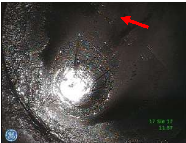
e) Denko tłoka (zbliżenie) – nieznaczne osady zanieczyszczeń, widoczny numer identyfikacyjny (katalogowy)