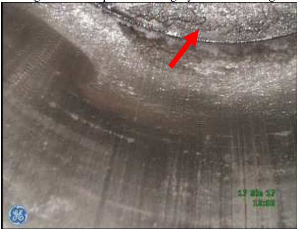
c) Przestrzeń robocza w rejonie GMP tłoka – osady nagaru na dolnej płycie głowicy