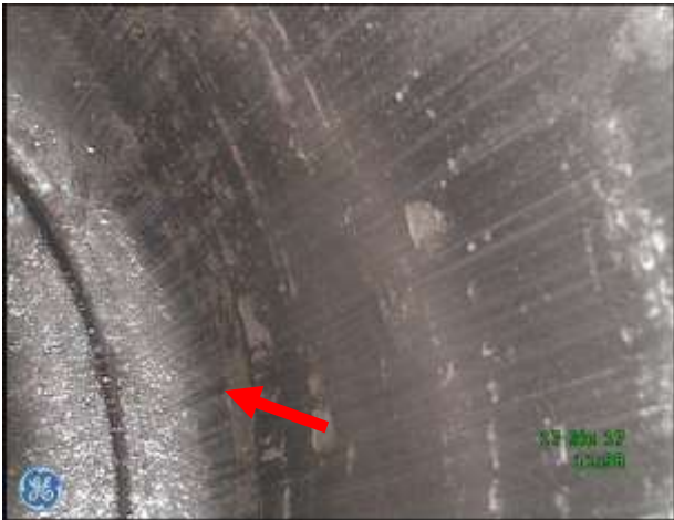
a) Gładź cylindrowa w rejonie DMP - ślady zużycia ściernego, brak śladów "honowania" tulei