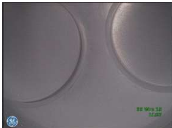
d) Dolna płyta głowicy z gniazdami zaworowymi