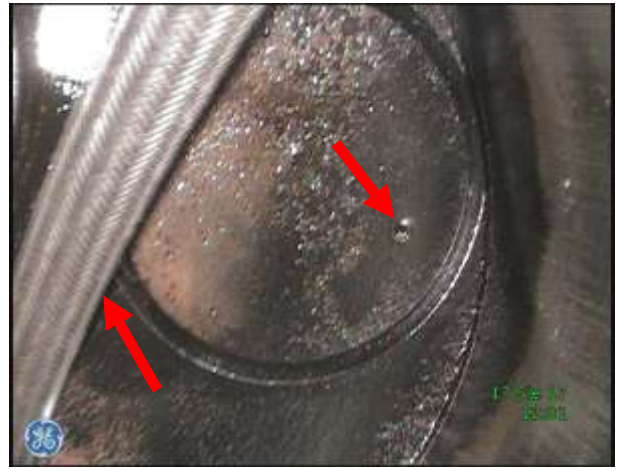
b) Dolna płyta głowicy, zawór wylotowy – widoczna sonda inspekcyjna wideoendoskopu, nieznaczne wgniecenie na powierzchni grzybka zaworowego