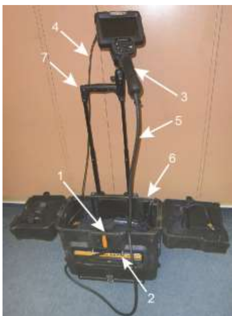
Rys. 2. Widok ogólny wideoendoskopu pomiarowego Everest typu XLG3 przygotowanego do użytkowania: 1 – jednostka centralna; 2 – panel sterowniczy; 3 – rękojeść videosondy; 4 – sonda inspekcyjna; 5 – światłowód iluminacji obiektu; 6 – walizka; 7 – rączka transportowa (montażowa)

Masa kompletnego, gotowego do pracy systemu, z wbudowanym wyświetlaczem LCD o przekątnej 15 cm, wynosi 12 kg (masa systemu wraz z walizką wynosi 22 kg).