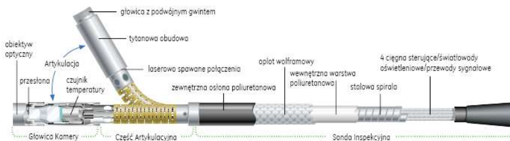
Rys. 3. Schemat ideowy sondy inspekcyjnej wideoendoskopu [10]

Wideoendoskop XLG3 jest wyposażony w wymienną sondę inspekcyjną (rys. 3), o następujących parametrach: średnica 6,1 mm, długość 3,0 m. Końcówka sondy, sterowana przy pomocy joysticka na rękojeści (kontrola sterowania artkulacji, z funkcją elektronicznej blokady położenia i automatycznym powrotem do pozycji wyprostowanej sondy), umożliwia jej wygięcie o kąt 120^\circ w każdym kierunku (górną–dół / lewo–prawy). Przetwarzanie obrazu optycznego na elektroniczny odbywa się za pośrednictwem kamery CCD SUPER HEAD TM o średnicy 4,2 mm, rozdzielczości 440 000 pikseli, umieszczonej w głowicy końcówki wziernikowej, o średnicy 6,1 mm, zapewniającej ciągły zoom cyfrowy (3,0×) oraz odwracanie obrazu lewo–prawy. Zapis cyfrowy kolorowego obrazu jest przesyłany szyną transmisyjną (przewody sygnałowe) sondy inspekcyjnej do jednostki centralnej zestawu, a następnie poprzez cyfrowe procesory obrazu przesyłany jest do monitora LCD (przekątna 16,3 mm, tryb panoramiczny 16×9, matryca 800×480 pikseli, jasność 380 Cd/m 2 ) zamontowanego w rękojeści wideosondy nad panelem manualnym.