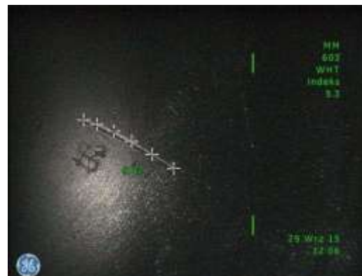
d) Pomiar długości wielosegmentowej (łamanej) rysy denku tłoka wykonany metodą „Cienia” - 5,42 mm z indeksem dokładności 5.3 odpowiadającemu błędowi bezwzględnemu rzędu 0,25 mm